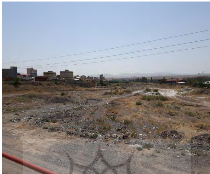
شکل (۴): نمایی از ساخت و ساز صورت گرفته در بستر رودخانه قوری‌چای