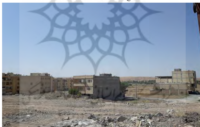
شکل (۵): نمایی دیگر از توسعه فضایی شهر در بستر رودخانه قوری‌چای