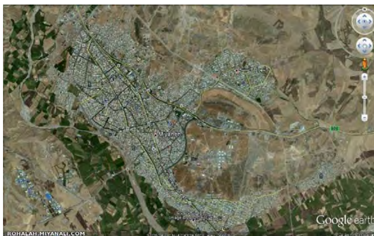
شکل ۳: شکل‌گیری شهر میانه در کرانه رودخانه قوری‌چای و قرانقوچای و توسعه فضایی قسمتی از شهر بر روی بستر آن‌ها

رودخانه‌ی قوری‌چای به عنوان رودخانه‌ی سیل‌خیز شهر میانه با طول ۳۸ کیلومتر در سمت شمال‌غرب شهر با آورد ۲۲ میلیون مترمکعب، رودخانه‌ای فصلی است. براساس گزارش اداره آب شهرستان میزان دبی سیلاب با دوره‌ی بازگشت رودخانه در جدول شماره ۱ ارائه گردیده است.