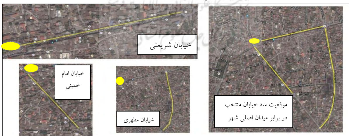
شکل شماره ۲: موقعیت و محدوده سه خیابان مورد بررسی در شهر رشت

روش تحقیق مورد استفاده در این پژوهش توصیفی-تحلیلی است. روش گردآوری اطلاعات بر اساس مطالعه کتابخانه ای، مشاهده میدانی و استفاده از روش تحلیل سلسله مراتبی صورت پذیرفته است. روش تحلیل سلسله