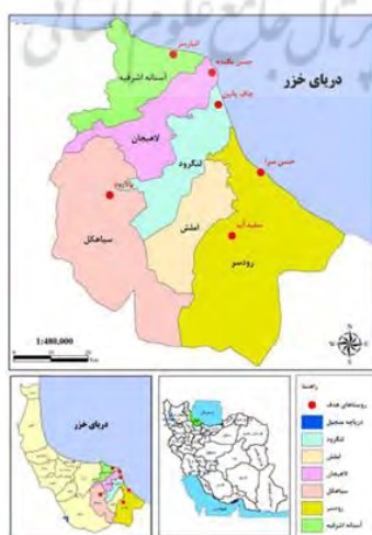
شکل ۲. موقعیت روستاهای هدف گردشگری در شرق استان گیلان