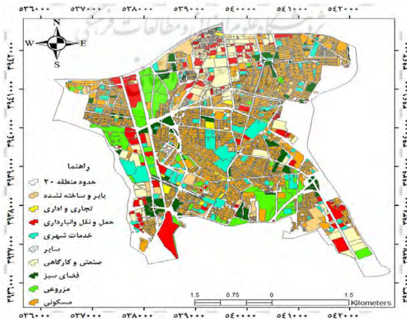
شکل شماره ۲- نقشه کاربری منطقه ۲۰