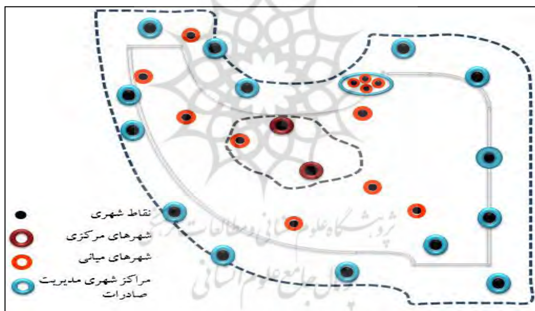
شکل ۱- نمایش مرکز- پیرامون در فضای سرزمینی کشور ایران

نظریات قطب رشد و مرکز- پیرامون بوده است. این رویکرد که از زمان پهلوی و با شروع برنامه‌های توسعه و افزایش درآمد نفت و شکل‌گیری برنامه‌ریزی سرزمینی در کشور حاکم شد و در ادامه در دوران جمهوری اسلامی نیز ادامه یافته است، همچنان بر نظام برنامه‌ریزی کشور تسلط کامل دارد. در این رویکرد مرزها، مناطق دور از مراکز به‌ویژه پایتخت و مراکز بزرگی مانند اصفهان و مشهد، حواشی و پیرامون و روستاها و شهرهای کوچک و میانی به عنوان یک منطقه استعمار شده در نظر گرفته می‌شود که به تنهایی استحقاق توسعه درون‌زا را ندارد و می‌بایستی وابسته به قطب رشد و مرکز سلطه‌گر براساس نظریات مذکور باشد. در این رویکردها و در نظام برنامه‌ریزی سرزمینی ایران، همیشه یک منطقه بزرگ از کشور به عنوان حاشیه در نظر گرفته می‌شود و یک منطقه هسته و مرکز سلطه‌گر و هدایت‌گر نیز بر این منطقه استیلا و کنترل دارد. این مسئله به شکلی تثبیت شده است که حتی در برنامه‌های آمایش سرزمینی نیز قطب‌ها و مراکز رشد و توسعه جایگاه خود را حفظ کرده‌اند و با نفوذی که در برنامه‌ریزی سرزمینی دارند، توسعه غیرآمایشی و خارج از توان و منطق جغرافیایی خود را توجیه می‌کنند. در نقشه (۱) وضعیت کلی مناطق مرکز- پیرامون در برنامه ملی آمایش سرزمین که مبنای برنامه پنج‌ساله ششم توسعه است، در فضای سرزمینی کشور نمایش داده شده است.