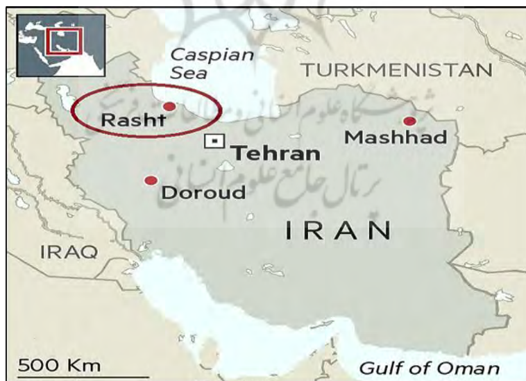
نقشه ۱- موقعیت شهر رشت

شهر رشت یکی از کلان‌شهرهای ایران و مرکز استان گیلان است، همچنین بزرگ‌ترین و پرجمعیت‌ترین شهر شمال ایران در بین سه استان حاشیه‌ای دریای خزر (مازندران، گیلان، گلستان) محسوب می‌شود. تقریباً در مرکز جلگه گیلان قرار گرفته و در طول جغرافیایی ۴۹ و ۳۵ درجه و ۳۷ و ۱۶ درجه واقع است. ارتفاع متوسط آن از سطح دریا ۸ متر است. فاصله شهر رشت تا شهر تهران ۳۲۵ کیلومتر است و مسیر تهران، رشت از شهرهای قزوین رودبار منجیل و لوشان و از کنار مهم‌ترین رود کور یعنی سفید رود گذر می‌کند. شهر رشت با وسعتی بیش از ۵۰ کیلومتر مربع بزرگ‌ترین شهر کناره دریای خزر به شمار می‌رود، شهر گیلان در جلگه گیلان و در حاشیه غربی دلتای سفید رود قرار گرفته است. آب و هوای رشت معتدل و در بعضی مواقع مه آلود است و از مناطق پرباران ایران به شمار می‌رود. متوسط درجه حرارت سالانه شهر رشت تقریباً معادل ۱۵ درجه سانتی‌گراد است و این در حالی است که حداکثر مطلق درجه حرارت تا ۳۷ درجه سانتی‌گراد و حداقل ۱۹ درجه زیر صفر نیز گزارش شده است متوسط بارندگی سالانه این شهر ۱۳۵۶ میلی‌متر است و معدل تعداد روزهای یخبندان در طول سال در حدود ۲۴ روز است.