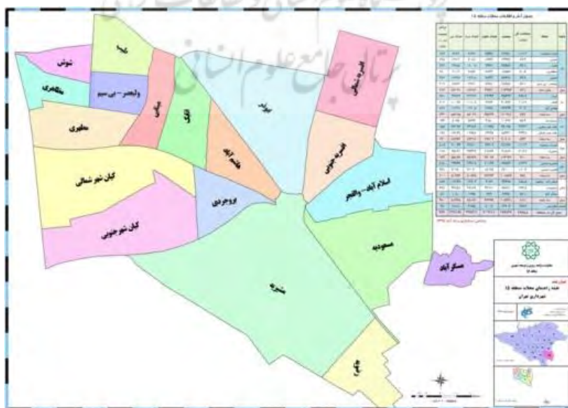
تصویر شماره (۲): نقشه تقسیمات نواحی و محلات منطقه ۱۵ در کلانشهر تهران منبع: یافته‌های پژوهش

تعداد محله‌های منطقه ۱۵ در داخل شهر تهران ۲۰ محله است. تعداد محله‌های ناحیه یک ۶ محله، ناحیه دو ۳ محله، ناحیه سه ۳ محله، ناحیه چهار ۲ محله، ناحیه پنج ۲ محله، ناحیه شش ۳ محله، ناحیه هشت ۱ محله است که تصویر (۲) نقشه تقسیمات نواحی و محلات این منطقه را نشان می‌دهد.