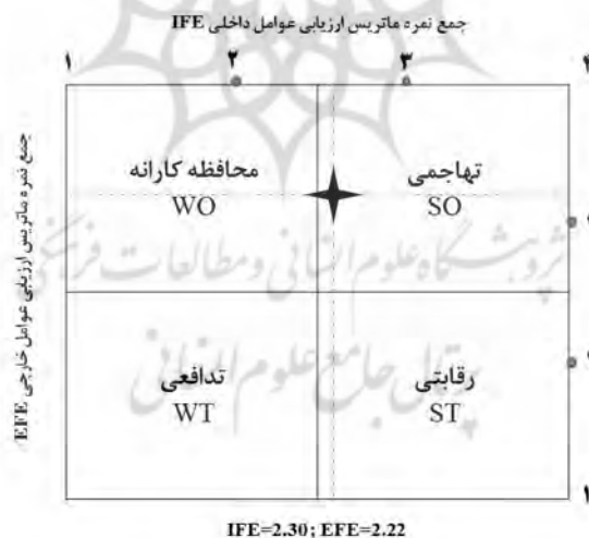
شکل ۲ ماتریس چهار خانه‌ای و موقعیت استراتژیک توسعه گردشگری ورزشی در شهر قشم

همانگونه که ملاحظه می‌شود این ماتریس سه وضعیت اصلی را مشخص کرده و سه دسته راهبرد را پیشنهاد می‌کند.