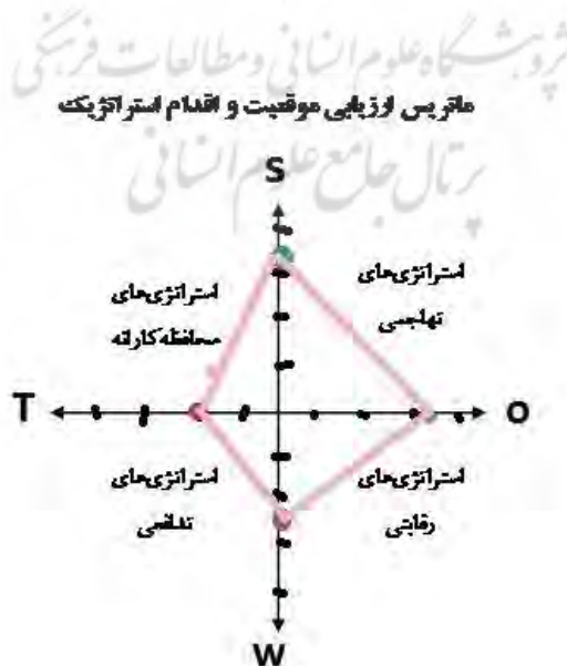
شکل ۲: ماتری ارزیابی موقعیت و اقدام استراتژیک

استراتژیست‌ها با استفاده از ماتریس ارزیابی عوامل خارجی می‌توانند عوامل اقتصادی، اجتماعی، فرهنگی، بوم شناسی، محیطی، سیاسی، قانونی، دولتی، حقوقی و اطلاعات رقابتی را مورد ارزیابی قرار دهند(عبدالله زاده، ۱۳۹۴:۱۲).