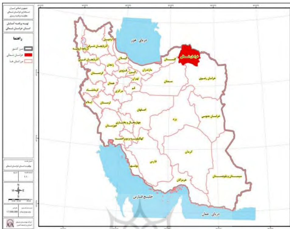
نقشه ۱- موقعیت استان خراسان شمالی

استان خراسان شمالی با مساحتی حدود ۲۸۱۷۹ کیلومتر مربع از ۸ شهرستان بجنورد (مرکز استان)، شیروان، اسفراین، مانه و سملقان، راز و جرگلان، جاجرم، فاروج و گرمه تشکیل شده‌است. این استان از نظر موقعیت جغرافیایی؛ از شمال با کشور ترکمنستان، از شرق و جنوب با استان خراسان رضوی، از جنوب غربی با استان سمنان و از غرب با استان گلستان هم‌مرز است.