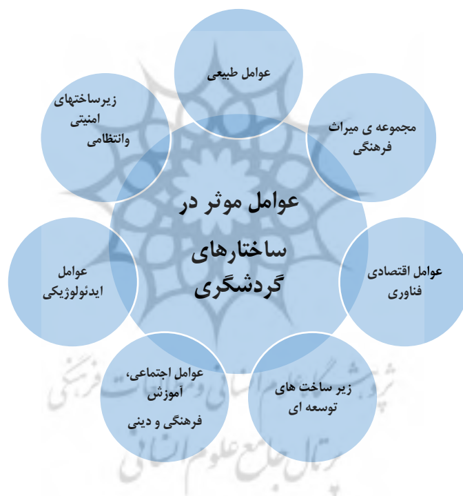
عوامل موثر در ساختار گردشگری روستایی (میرزائی، ۱۳۹۳)

روستایی می‌گردد. هدف توسعه پایدار روستایی گسترش امکانات و بهبود شرایط زندگی نسل کنونی و نسل‌های آتی اقشار آسیب‌پذیر روستایی است (رضائی و همکاران، ۱۳۹۴، ۳۸). گردشگری روستایی به عنوان یک کارکرد فرا ساختاری، از راه مشارکت با سایر بخش‌های اقتصادی گسترش و تداوم می‌یابد و به تبع آن در رشد سایر بخش‌های اقتصادی جامعه نیز نقش دارد. در این راستا اهمیت خاص صنعت گردشگری به دلیل افزایش تعاملات اقتصادی، رشد بخش‌های مختلف اقتصادی گسترش تعاملات اجتماعی بین جوامع روستایی و شهری و ملل مختلف است. گردشگری یک محصول اجتماعی است و با مهارت‌های کارآفرینی و کسب و کار گردشگری همراه است. همچنین توانایی‌های محلی و اجتماعی، رهبری محلی و شبکه‌های رسمی و غیر رسمی، به طور مستقیم در توسعه و بهبود گردشگری مشارکت دارد، در حالیکه رویکرد اجتماع - محور، شیوه موثری برای توسعه و بهبود گردشگری است، ایجاد همکاری در درون جامعه محلی، روند پیچیده‌ای دارد. کسب و کار منابع مشترکی را همزمان با رقابت طلب می‌کند (Getz, 1995).