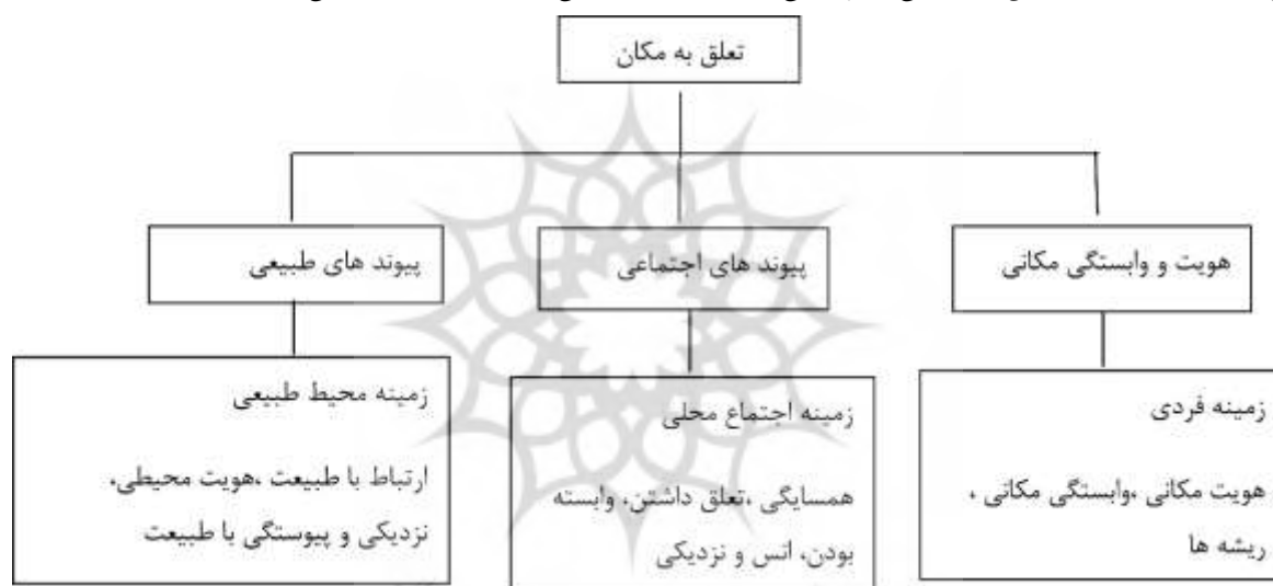
نمودار ۱: مدل مفهومی سه بعدی تعلق به مکان (ریموند و همکاران، ۲۰۱۰)

(Scannell&Gifford,2010:2) ریموند و همکاران (۲۰۱۰) تعلق مکانی را در مقیاسی پنج عنصری توسعه داده اند که شامل عناصر هویت مکانی، وابستگی مکانی، پیوندهای طبیعی، پیوندهای خانوادگی و پیوندهای دوستی است. عناصر هویت مکانی، وابستگی مکانی و ریشه ها، در زمره زمینه های فردی تعلق به مکان قرار دارند. هویت مکانی به ارتباط معنادار یک فرد با مکانی اشاره دارد که وی را تعریف می کند. وابستگی مکانی به روابطی مربوط است که ما برای استفاده از مکان داریم، به طوری که مکان با برآورده کردن نیازهای مادی و معنوی انسان، وابستگی شخص را به خود تحت تأثیر قرار می دهد و ریشه ها نیز شامل خوگیری طولانی مدت در مکانی واحد است. عنصر پیوندهای اجتماعی، زمینه های اجتماع محلی تعلق به مکان را نشان می دهد که با خانواده و دوستان برقرار است. در حوزه زمینه های اجتماع محلی، تعلقات همسایگی، حس وابسته بودن، تعلق داشتن به اجتماع محلی و آنسی ۳ که شخص به یک مکان دارد، جای می گیرند. عنصر پیوندهای طبیعی نیز، به زمینه های محیطی تعلق به مکان اشاره دارد. پیوندهای طبیعی، حس ارتباط با طبیعت / حس وابستگی و نزدیکی به طبیعت و توانایی شناخت محیط طبیعی است.