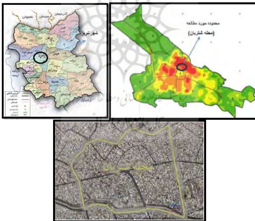
شکل ۱: موقعیت محله شتربان در شهر تبریز

ها و وابستگی ذهنی شهروندان به محله‌ها و کوی‌ها، هنوز کارایی خود را از دست نداده است. در این چارچوب، دریافت شهری تبریز، ۹ محله اصلی قابل شناسایی است. که هر محله همه کاربری‌ها و عناصر را در خود داشت و در سطح محله‌ای خدمات ارائه می‌داد و تا حدودی بی‌نیاز از محلات اطراف بود به طوری که اکثر آنها دارای حمام، مسجد، بازار، قبرستان و غیره بوده‌اند (صفا منش، ۱۳۷۷: ۴۱) محله‌های هم‌جوار اگرچه با مرز بندی مشخصی از هم جدا نمی‌شوند، ساختار کالبدی آنها هنوز هم در شکل گذرهای اصلی و فضاها شهری عمده و کوی‌های داخلی هر محله پا برجاست. محله‌های تاریخی شهر به عنوان مناطق قدیمی و فرسوده شهر همواره در حال نوسازی و تغییر می‌باشد و این امر احتمال تضعیف پیوند ساکنین با محلات تاریخی را افزایش می‌دهد. طی ده سال اخیر محله شتربان به عنوان یکی از محلات تاریخی شهر واقع در منطقه ۱۰ تبریز، در حال نوسازی می‌باشد که همجواری بافت تاریخی و بافت جدید و تلفیق این دو با یکدیگر در جریان نوسازی این محله امکان مطالعه و بررسی تأثیرات هر دو بافت را فراهم می‌کند. محله شتربان جزء محلاتی در شهر تبریز است که همواره اصالت خود را حفظ کرده و به نظر می‌رسد ساکنین قدیمی محله با وجود نوسازی و تغییر بافت محله تعلق خود را نسبت به آن حفظ کرده‌اند. مطالعه حس تعلق در محله‌ای با این خصوصیات می‌تواند اطلاعات ارزشمندی در اختیار قرار دهد.