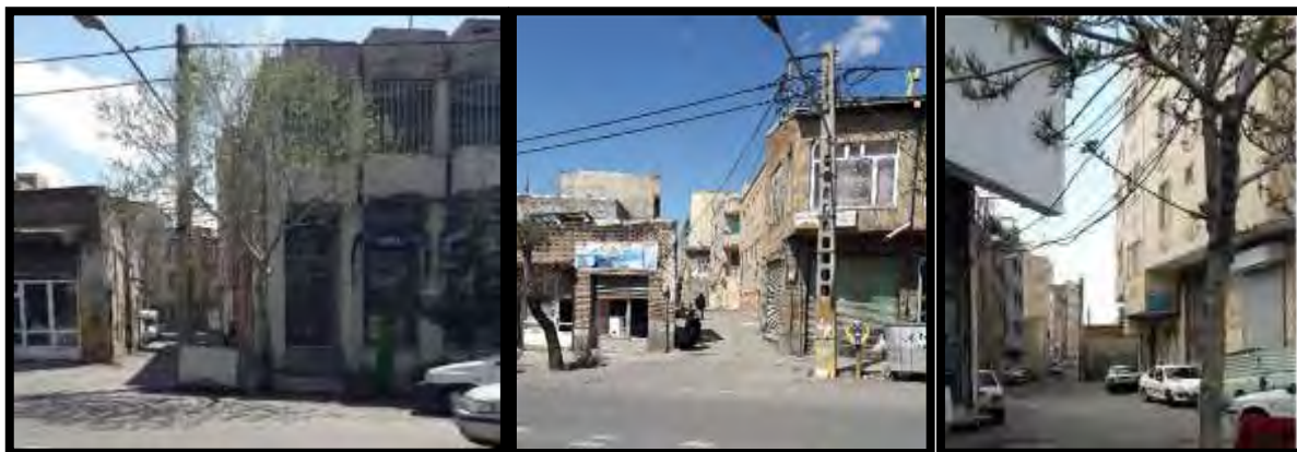
شکل ۲: تصاویری از محله شتربان در شهر تبریز