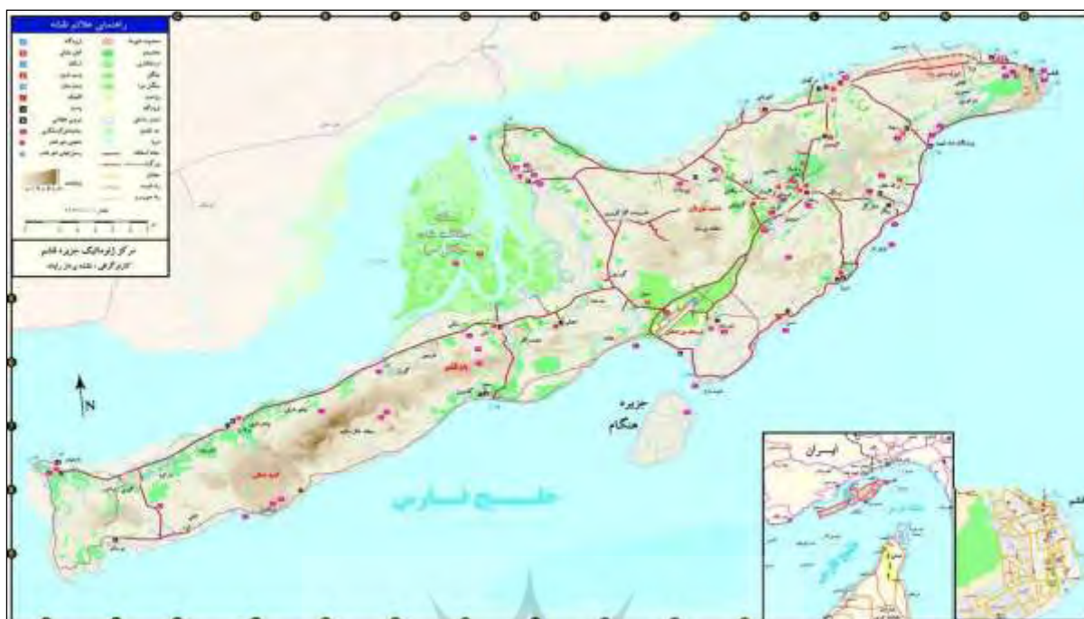
نقشه شماره ۳- موقعیت جغرافیایی خلیج فارس

جزیره قشم با وسعت ۱۵۰۰ کیلومتر مربع (۰/۱ درصد مساحت کشور) و ۲۶۰ کیلومتر ساحل (حدود یک درصد طول سواحل آبی کشور) و بیش از یکصد هزار نفر جمعیت، به راحتی می‌تواند با بهره‌گیری از اصول صحیح آمایش سرزمین و توسعه پایدار، سالانه پذیرای بیش از ۳ تا ۴ میلیون نفر مسافر داخلی و هزاران مسافر خارجی از منطقه آسیای میانه، حاشیه دریای خزر، ارمنستان و گرجستان در فصول پاییز و زمستان به صورت بازدید روزانه، ترانزیت و اقامت شبانه یا چند روزه باشد. آمایش حمل و نقل و گردشگری جزیره قشم نیاز به توجه جدی و عمیق به ابعاد مختلف سیاسی، امنیتی، اقتصادی، فرهنگی، اجتماعی، زیست محیطی و فنی- مهندسی دارد.