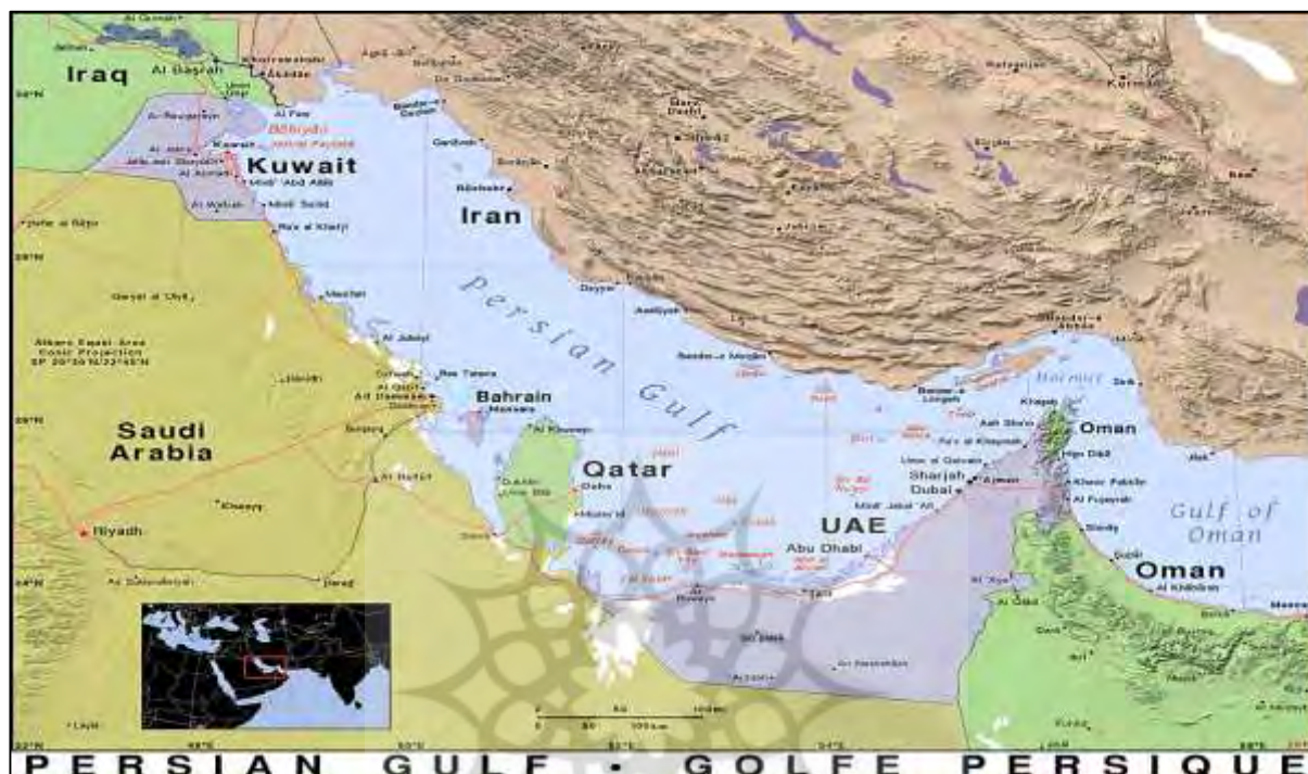
نقشه شماره ۱- موقعیت خلیج فارس و جزیره قشم

خلیج فارس ۲۳۷۴۷۳ کیلومتر مربع است و پس از خلیج مکزیک و خلیج هادسون سومین خلیج بزرگ جهان بشمار می‌آید. خلیج فارس از شرق از طریق تنگه هرمز و دریای عمان به اقیانوس هند و دریای عرب راه دارد و از غرب به دلتای رودخانه اروندرود که حاصل پیوند دو رودخانه دجله و فرات و پیوستن رود کارون به آن است، ختم می‌شود (قراگز لو، ۱۳۷۹: ۵۳).