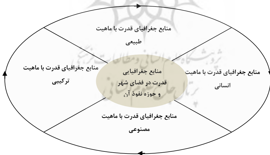
شکل ۲: چرخه اولیه مطالعه ژئوپلیتیک شهر منبع: نگارندگان