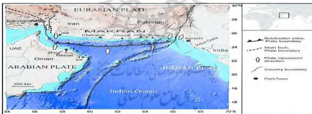
نقشه ۳- موقعیت دقیق منطقه مکران