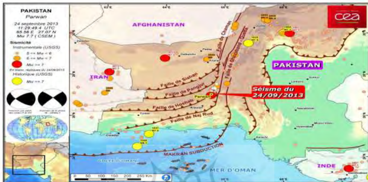
نقشه ۲- کریدور مکران

شکل‌گیری بازارهای جدید جهانی در حوزه اقیانوس هند و خلیج فارس، برای هر دو قاره آسیا و اروپا دارای اهمیت فراوانی است.