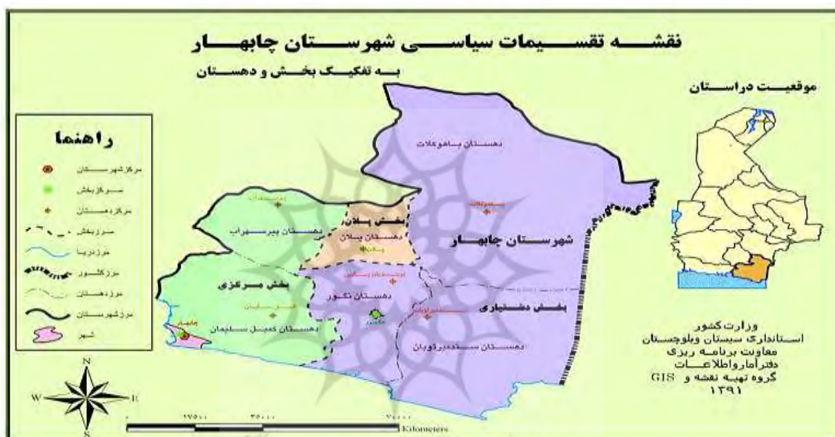
نقشه ۵- شهرستان چابهار

جایپور، حصیرآباد، کراچی و بن قاسم به چابهار می‌رسد (ابراهیم زاده و آقاسی زاده، ۱۳۸۸: ۱۰۷). بندر چابهار به دلیل موقعیت راهبردی که نزدیک‌ترین راه دسترسی کشورهای محصور در خشکی آسیای میانه (افغانستان، ترکمنستان، ازبکستان، تاجیکستان، قرقیزستان و قزاقستان) به آب‌های آزاد است از اهمیت فراوانی برخوردار است و سازندگی و سرمایه‌گذاری فراوانی در آن صورت می‌گیرد؛ از جمله ساخت اسکله و افزایش گنجایش بارگیری کشتی‌های اقیانوس‌پیما و ساخت راه‌آهن به سوی آسیای میانه و احداث فرودگاه بین‌المللی. این بندر یکی از مهم‌ترین چهارراه‌های کریدور شمال-جنوب بازرگانی جهانی است (عسگری کرمانی، ۱۳۹۵: ۱۷). منطقه آزاد چابهار با مساحت ۱۴ هزار هکتار در منتهی‌الیه جنوب شرقی ایران در ۲۵ درجه و ۲۰ دقیقه عرض شمالی و ۶۰ درجه و ۲۷ دقیقه طول شرقی در شرق خلیج چابهار و در کنار آب‌های دریای عمان قرار دارد (پرتوی، ۱۳۸۵: ۱۷).