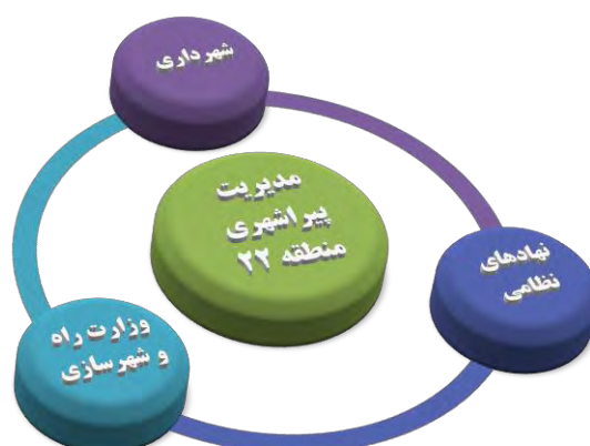
شکل ۲- مثلث مسلط مدیریت منطقه در وضعیت فعلی

در گام بعد ۵ نقش اساسی سیاستگذاری، برنامه ریزی، اجرا، نظارت و کنترل به عنوان نقش‌های کلان و اساسی مدیریت در نظر گرفته شد تا بر همین مبنا نقش‌های کنشگران و ذی نفعان اصلی منطقه در وضعیت مطلوب و پیشنهادی مشخص گردد. جمع‌بندی نهادها و نقش‌های ایجابی آنها در وضعیت پیشنهادی به شکل زیر قابل ارائه است: