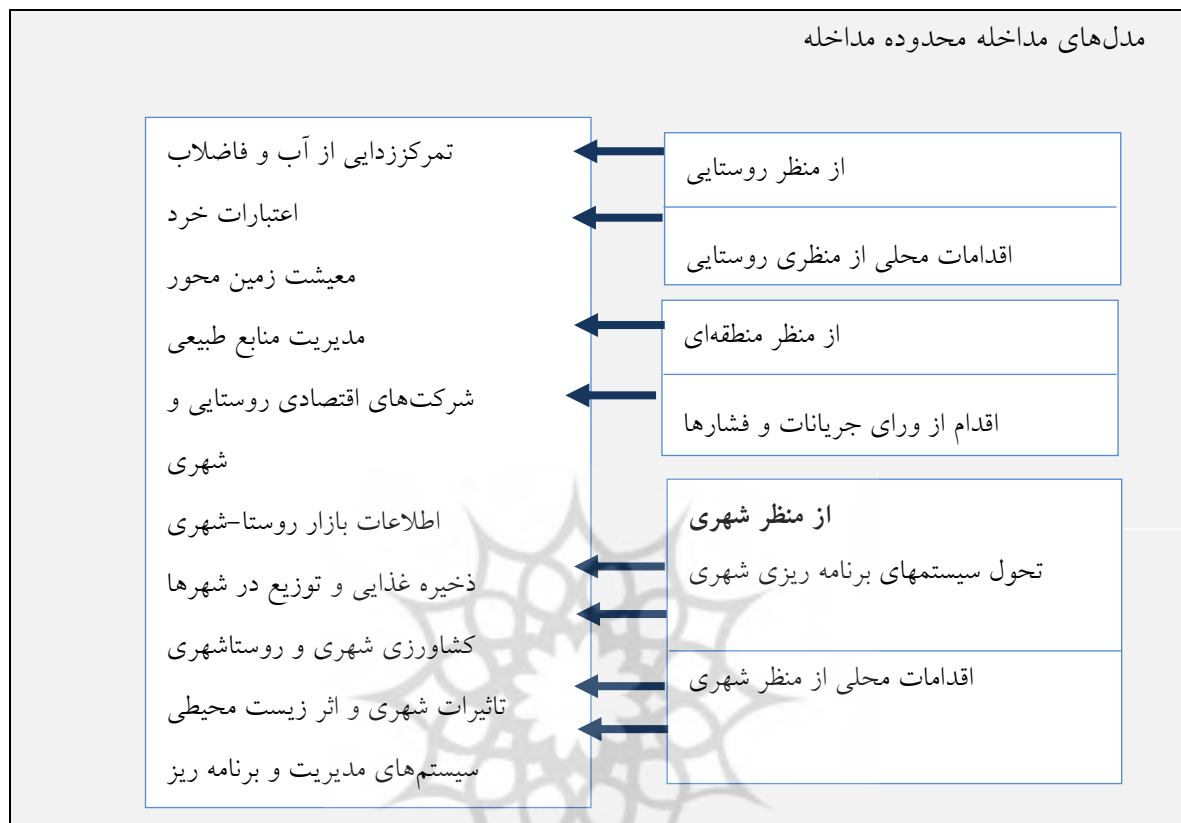
شکل ۱: مدل‌های مختلف مداخله مدیریتی در پیراشهرها

به علاوه این مدلها را می‌توان تحت سه مدل مداخله دسته بندی کرد. در چشم انداز برنامه ریزی روستایی تمرکز بر اقدامات محلی و مجزا قرار می‌گیرد؛ اهداف منطقه‌ای به دنبال اقدام ورای فشارها و جریانات شهری-روستایی است؛ و اهداف شهری به دنبال تحول سیستمهای برنامه ریزی و نهادهای مربوط به آنهاست. (Allen,2003,136)