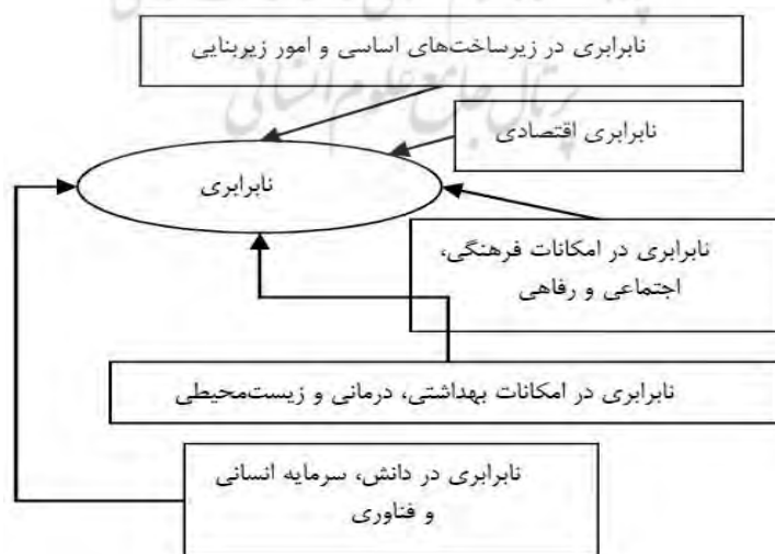
شکل (۱): ابعاد تأثیرگذار بر نابرابری منطقه‌ای منبع: کریمی و براتی، ۱۳۹۶: ۵۱؛ Bin, 2015: 1