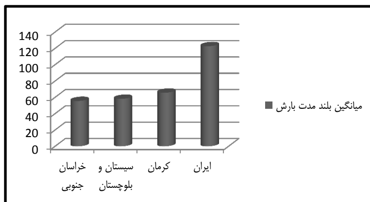
شکل ۲: میانگین بارش استانی مورد مطالعه در مقایسه با کل کشور در دوره ۱۳۷۰-۱۳۹۲