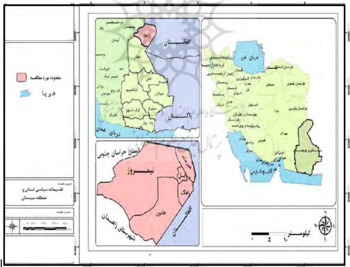
شکل شماره ۱: نقشه موقعیت جغرافیایی محدوده مورد مطالعه

استان سیستان و بلوچستان نیز در منتهی الیه جنوب شرقی کشور، از نظر موقعیت جغرافیایی در مختصات ۲۵ درجه و ۳ دقیقه تا ۳۱ درجه و ۲۹ دقیقه عرض شمالی و ۵۸ درجه و ۵۱ دقیقه تا ۶۳ درجه و ۲۰ دقیقه طول شرقی واقع شده است. این استان از شمال با استان خراسان جنوبی همجوار است و از شرق با یک مرز خاکی به طول ۱۱۰۰ کیلومتر، دیواره‌ی همسایگی ایران با کشورهای افغانستان و پاکستان را تشکیل می‌دهد. از مغرب به استانهای کرمان و هرمزگان می‌رسد و جنوب آن نواره‌ی آبی ۳۰۰ کیلومتری دریای عمان می‌باشد. منطقه سیستان (شهرستان زابل) حوزه فراگیر شهر زابل است، که در منتهی الیه شرقی کشور ایران واقع شده است. این منطقه قسمتی از استان پهناور سیستان و بلوچستان می‌باشد و با قرارگیری در شمال این استان قسمت وسیع و مهمی از استان و حتی ایران را به خود اختصاص داده است (شکل شماره ۱ و شکل شماره ۲).