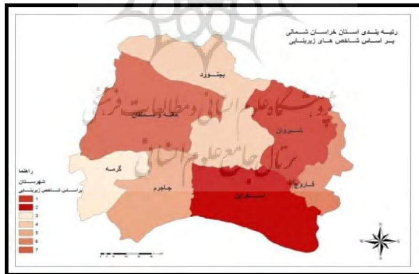
نقشه شماره (۳) و (۴) رتبه‌بندی شهرستان‌های استان خراسان شمالی بر اساس شاخص درمانی و زیربنایی