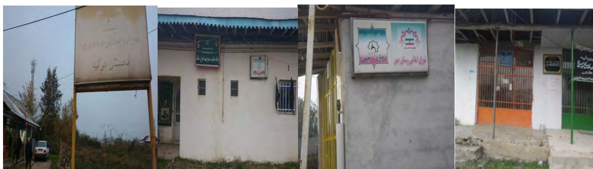
عکس تصاویر برخی از دهیارها و شوراهای اسلامی در روستاهای شهرستان صومعه سرا

مدیریت روستایی در ایران از اوایل شکل‌گیری به گونه‌های متفاوتی نمود یافته و فرازو نشیب‌های فراوانی را به لحاظ تشکیلات و زیربنای قانونی داشته است. پس از استقرار نظام جمهوری اسلامی، با تصویب قانون تشکیلات شوراهای اسلامی کشوری (مصوب ۱۳۶۱) نهاد مدیریتی جدیدی تحت عنوان شورای اسلامی روستا به عنوان متولی مدیریت روستایی معرفی شد. ولی از آنجا که در این قانون هیچ گونه نقش اجرایی برای شورا تعریف نشده بود، این نهاد هیچ گاه نتوانست جایگاه واقعی خود را در مدیریت روستایی بیابد و خلاء مدیریتی روستاها را پر کند. بالاخره در سال ۱۳۷۵ با تصویب قانون شوراها و همچنین قانون دهیاریهای خودکفا در روستاهای کشور (مصوب ۱۳۷۷) مدیریت روستایی برعهده شورا و دهیاری گذاشته شد. بدین ترتیب که شورا به عنوان نهاد تصمیم گیر، برنامه ریز و سیاستگذار و دهیاری نیز به عنوان بازویی اجرایی شورا و مسئول اجرایی مدیریت روستا پایه عرصه مدیریت روستایی کشور گذاشت و تجربه جدیدی در عرصه مدیریت روستایی شکل گرفت. شهرستان صومعه سرا دارای یکصد و پنجاه آبادی دارای سکنه و یک آبادی خالی از سکنه بوده که در اکثر این آبادیها دهیار و یا شورای روستا مدیریت می‌کنند. هریک از دهیاران با توجه به وظایف محول شده توسط مراجع بالاتر در کشور زیر نظر بخشداری و فرمانداری شهرستان در روستاها خدمت می‌نمایند. تصاویر زیر برخی از دهیارها و شوراهای نه چندان مناسب در این شهرستان می‌باشد.