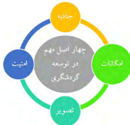
شکل (۲) چهار اصل مهم توسعه صنعت گردشگری