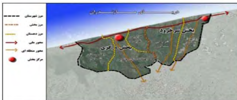
شکل (۱) شکل شهر سرخرود

✓ بقعه مبارکه آقا سید عبدالمجید که از سادات علوی و مامن شیفتگان و علاقمندان به خاندان نبوت می باشد، هر سال پذیرای خیل عظیم ارادتمندان می باشد و در هسته مرکزی شهر واقع شده است (طرح جامع وتفصیلی سرخرود، ۱۳۹۱).