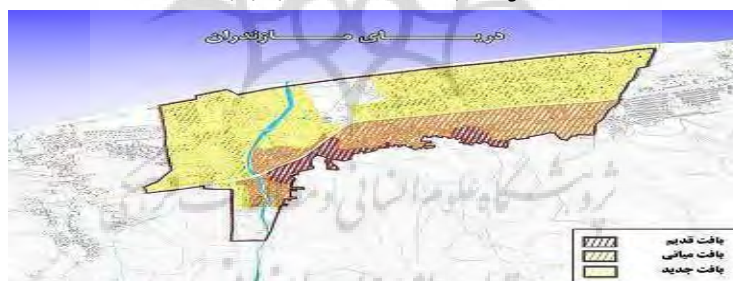
شکل (۳) یافت قدیم و جدید سرخرود