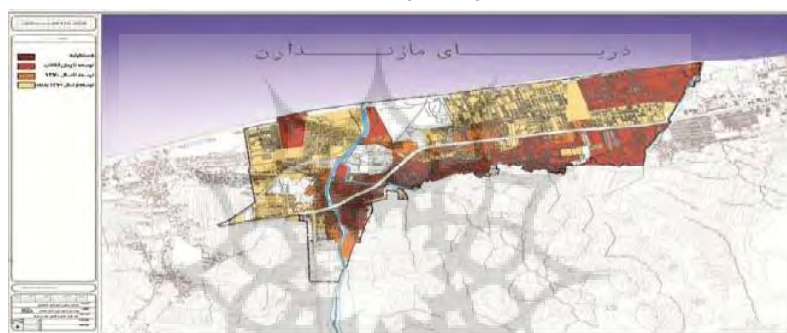
شکل (۲) توسعه ادواری کالبدی شهر سرخرود