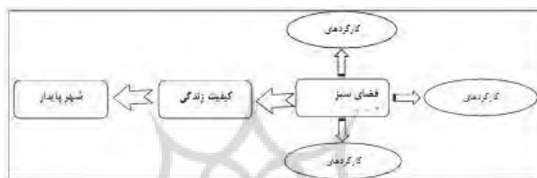
شکل (۱): ارتباط مفهومی بین فضای سبز شهری، کیفیت زندگی و شهر پایدار

در کشور ما پارک‌های شهری زاینده تحولاتی در عرصه زندگی اجتماعی و شیوه‌های باغ سازی می‌باشد که همگام با سایر جنبه‌های معماری و شهرسازی، از دوره قاجار آغاز و نتایج عمده آن با نیم قرن تأخیر، پا به عرصه فضای شهری گذاشته است (سلطانی، ۱۳۸۶: ۴۸). پارک‌های شهری از جنبه‌های اکولوژیکی، اجتماعی و اقتصادی دارای اهمیت می‌باشند. به گونه‌ای که یک پارک شهری مناسب در ارتباط با کارکردهای اجتماعی، اقتصادی، و اکولوژیکی علاوه بر اینکه نقش مهمی در ارتقای کیفیت زندگی شهری دارد، به عنوان یکی از پیش شرط‌های شهر پایدار نیز محسوب می‌شود (شکل ۱).