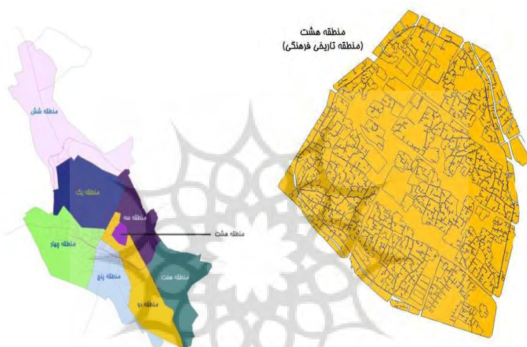
نقشه مناطق شهرداری شهر شیراز و موقعیت بافت قدیم

شهر شیراز در حال حاضر دارای ۹ منطقه تاریخی است که محدوده مورد مطالعه در منطقه ۸ قرار دارد. منطقه تاریخی فرهنگی ۸ شیراز مهمترین و با ارزش ترین منطقه شهر شیراز است.