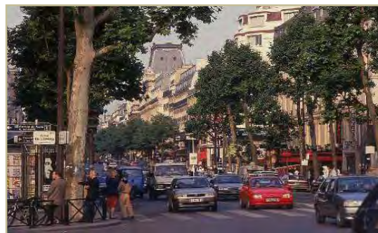
شکل ۲: خیابان شهری، فرانسه- پاریس