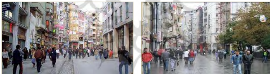
شکل ۱: خیابان شهری، خیابان استقلال - ترکیه

کیفیتی که از شهر برداشت می‌شود. بیش از هر چیز بستگی به کیفیت خیابان‌های آن دارد. شخصیت خیابان‌ها هم بستگی به طول بلوک‌ها و مقاطع آن‌ها (عرض سواره، و پیاده رو، ماهیت ارتفاع و عقب نشینی، ساختمان‌های جداره‌ها، تعداد ورودی به ساختمان‌ها، وجود یا عدم وجود ویترین مغازه‌ها و غیره) دارد. در خیابان به مثابه فضای شهری تنها عناصر کالبدی اهمیت ندارند بلکه خیابان به منزله واقعیتی اجتماعی - فرهنگی در ساختار فضایی شهر به صاحبان، مالکان، استفاده کنندگان و اداره کنندگان فضا نظر دارد. مجموعه این دو جنبه کالبدی و اجتماعی که مزوج با فعالیت‌های اقتصادی است باعث می‌شود که ما خیابان را فضای شهری بنامیم. در واقع جذابیت کالبدی با تحرک اجتماعی - فرهنگی و فعالیت‌ها در هم آمیخته است (توسلی، ۱۳۸۸، ۱۲۴).