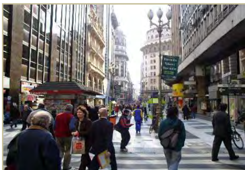
شکل ۳: خیابان شهری، آمریکا- نیویورک