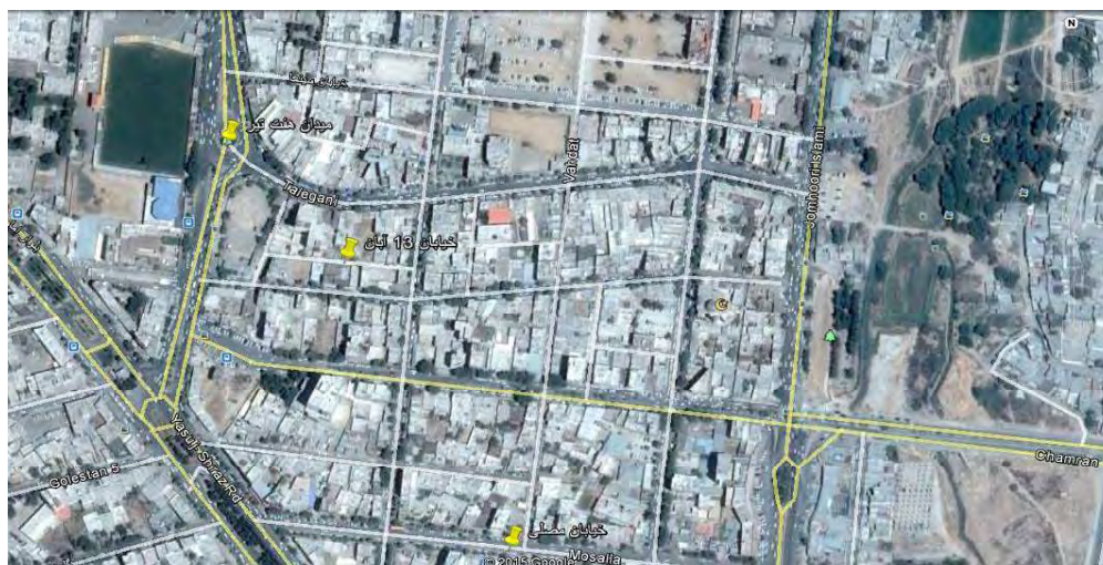
شکل ۵: موقعیت خیابان ۱۳ آبان در شهر یاسوج