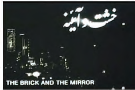
شکل ۳. تصویری از شب تهران