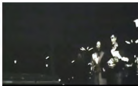
شکل ۵. پرسه‌زنی در شب (ماخذ: فیلم خشت و آینه، دقیقه ۴۰.۱۵)