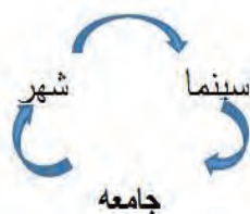
شکل ۱. نسبت شهر، سینما و جامعه