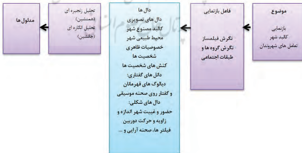
شکل ۲. مدل مفهومی پژوهش

موضوع بازنمایی: در یک تقسیم‌بندی کلی «موضوع بازنمایی» در اینجا شهر را می‌توان ترکیبی از دو مؤلفه دانست: «کالبد شهر» و «تعامل‌های میان انسان‌ها و میان انسان و شهر». در واقع با استفاده از این دو مؤلفه می‌توان تصویرهای گوناگون از شهر را از هم تمیز داد. از آنجا که مؤلفه اول بر کیفیت حضور و نمایش فیزیک شهر و مؤلفه دوم بر درک فیلم‌ساز از معنای شهر تأکید دارد، تلاش نگارنده بر آن بوده است تا با در نظر گرفتن هر دو عامل یاد شده، تصویرهای شهر و جامعه را در آثار سینمایی ایرانی شناسایی و تحلیل نمایند. هر دو عنصر «فاعل بازنمایی» و «موضوع باز نمایی» را می‌توان از یک نگاه دیگر تجزیه کرد. بدیهی است که موضوع بازنمایی ترکیبی است از: (۱) عناصر بی‌جان طبیعی و مصنوع که مثلاً می‌تواند ساختمان‌ها، خیابان‌ها و یا دیگر عناصر کالبدی مصنوع و یا احیاناً درختان، دریاچه‌ها، باران، رعد و برق و یا سایر عناصر طبیعی باشد. و (۲) موجودات زنده (مهم‌تر از همه انسان‌ها) به طور فردی و در گروه و کنش‌ها و تعامل‌های آنها. این تعامل‌ها در چارچوب نهادها، ارزش‌ها و هنجارها انجام می‌شوند که در مجموع حیات اجتماعی (و در کار ما حیات