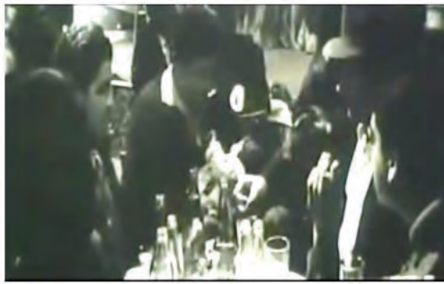
شکل ۴. خشت و آینه (هاشم در کافه) (ماخذ: فیلم خشت و آینه، دقیقه ۱۵:۳۰)