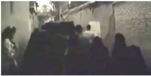
شکل ۱۰. مراسم تشییع