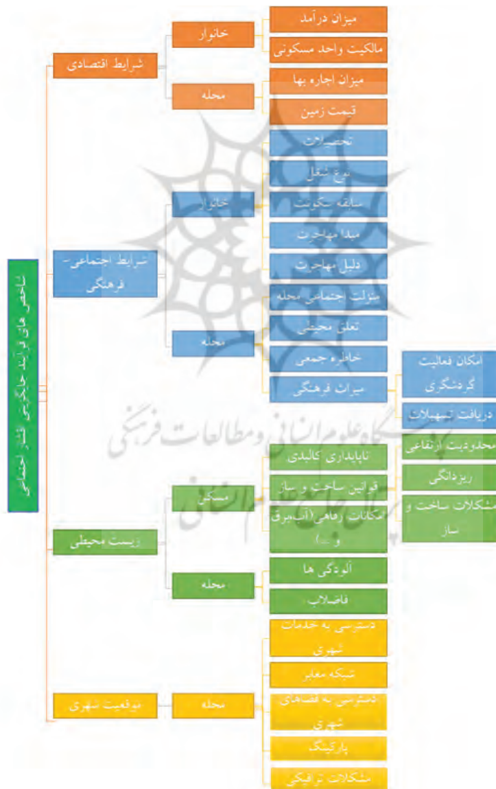
شکل ۲. مدل مفهومی و ساختار پژوهش

همواره هدف از مطالعه مبانی نظری استخراج معیارها و شاخص‌های پژوهش است. در خصوص شاخص‌های فرایند جایگزینی اقشار اجتماعی اندیشمندان نظریات متفاوتی بیان می‌دارند اما با بررسی تعاریف ارائه شده و مطالعه نمونه موردی‌ها می‌توان فصل مشترکی یافت. در واقع با مطالعه ساختار اجتماعی، فرهنگی، اقتصادی و کالبدی