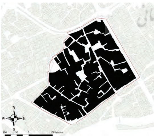
شکل ۶. شهر توده و فضا محله اوچدکان نقشه پایه شهرداری اردبیل

دسترسی‌های برون محله‌ای به دلیل بافت ارگانیک محله پیچ‌درپیچ است که از ضریب نفوذپذیری محله می‌کاهد (شکل ۵ و ۶). در خصوص ابعاد جمعیتی و ساختار اجتماعی بافت‌های قدیمی و تاریخی شهرها و از جمله شهر اردبیل حاکی از افول وجه سکونت در فضا و کاهش بطئی تعداد ساکنین در گذر و گذار از گذشته به حال است. این امر عمدتاً به دلیل ازدیاد و تراکم فعالیت‌های مرکز شهری جدید، فرسودگی کالبدی و ضعف نفوذپذیری کالبدی است که در مجموع از معیارهای مطلوبیت فضا می‌کاهد. در شهر اردبیل،