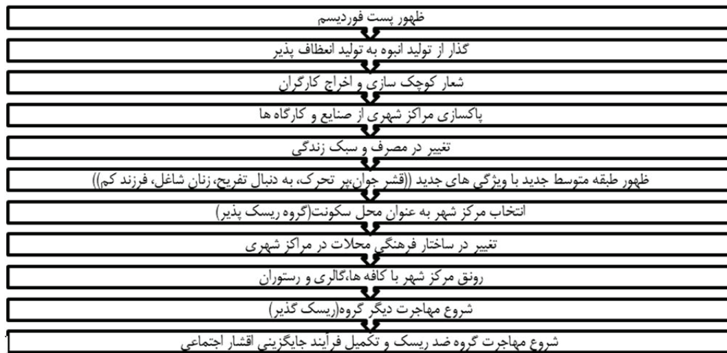
شکل ۷. نمایش تغییر ضریب پسا در نسبت با تغییر در فرم های با سطح مقطع دایره

سرمایه گذاری مجدد نیز تأثیری نخواهد داشت. برای مثال زمانی که یک صاحب خانه ملک خود را اجاره می دهد در صورت سرمایه گذاری مجدد به دلیل عدم توانایی دیگر ساکنان نمی تواند اجاره بها را افزایش دهد. به دلیل وضعیت نابسامان محله از نظر فیزیکی و سکونت طبقه متوسط، اقشار با درآمد بالا حاضر به زندگی در محله نخواهند شد. در نتیجه محله صرفاً به اجاره نشینی تبدیل می شود و با افزایش نابسامانی تفاوت اجاره بها روز به روز افزایش پیدا می کند» (اسمیت، ۱۳۹۰). فرضیه شکاف قیمت ۱۳ نیز توسط هامنت و راندولف ۱۴ مطرح شد که بیشتر برای کشورهای اروپای غربی مناسب است. کریس هامنت با توجه به نقدهایی که بر نمونه های آمریکایی وارد کرده بود و با در نظر گرفتن دخالت دولت در نمونه های اروپایی نظر شکاف قیمت را مطرح می کند. در واقع عملی شدن جایگزینی اقشار اجتماعی را که با ادامه سرمایه گذاری مجدد در محلات شهری همراه است، با عنوان شکاف قیمت یا ارزش املاک، مفهوم بندی کرده اند (Hamnted & Randolph, 1984). وقتی شکاف قیمت بین املاک و مسکن اصلاح نشده و مسکن تصرفی بهسازی شده به حداکثر برسد، فرآیند جایگزینی اقشار اجتماعی اتفاق خواهد افتاد؛ یعنی این شکاف بایستی به حدی بزرگ باشد که بتواند هزینه های بهسازی را جبران کند و تأمین کننده پرداخت های بهره منابع مالی و منافع تعداد زیادی از متصدیان باشد. رویکرد انسان گرایانه فر محور لای دیگر نظریه رویکرد جایگزینی است که در آن ارجحیت های فرهنگی و خصوصیات جمعیت شناسی افراد اعیان مورد تأکید قرار می گیرند. تخصصی شدن نیروی کار، تغییر در ساختار جنسیتی خانواده و محل کار و مجموعه خاصی از معانی زندگی در مرکز شهر، نیروهای محرک این فرآیند