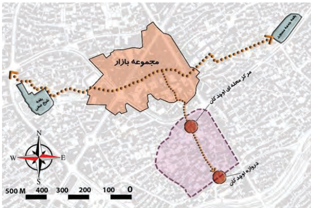
شکل ۴. ارتباط محله اوچدکان اردبیل با مجموعه بازار، نقشه پایه شهرداری اردبیل