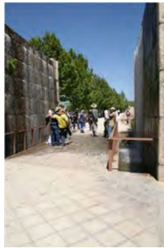
شکل ۹. دروازه آب.