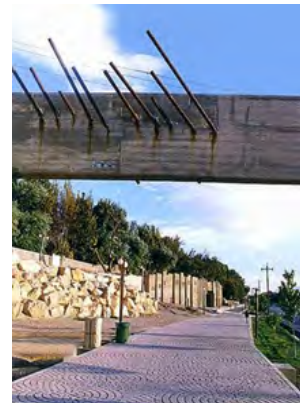
شکل ۱. دروازه قطعه بهار، باران، نام‌گذاری فضا و قاعده‌افزایی.

مجسم کرده‌اند (شکل ۱). اگر میلگرد به‌عنوان یک واژه در نظر گرفته شود، زبان معیار برای این واژه، استفاده آن در کارکرد سازه‌ای به‌عنوان عنصری کششی است. اما این واژه با انحراف از موضع کارکرد خود، تعریفی دوباره پیدا می‌کند و نقش جدیدی به خود می‌گیرد. همچنین است نقش تیرهای آهنی که به‌صورت مایل با زمین برخورد کرده و به درون آن فرورفته‌اند (شکل ۲). اینجا نیز از مفهوم تیرآهن به‌عنوان عنصری سازه‌ای آشنایی‌زدایی شده و در موقعیتی متفاوت با زبان معیار آن (نقش سازه‌ای) مورد استفاده قرار گرفته است. همچنین محل برخورد تیرها با زمین نوعی نمایش را بازسازی می‌کند که گویی واقعاً تیرها موجب تخریب کف شده‌اند و از کف روییده‌اند. در شکل نیز