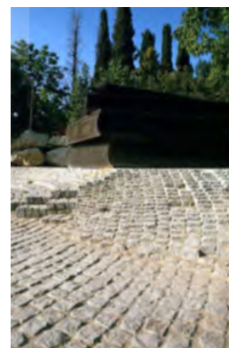
شکل ۳. کتاب، آشنایی‌زدایی با تغییر مقیاس.