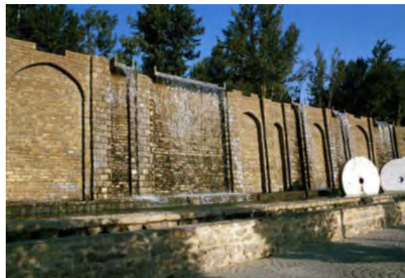
شکل ۷. مجاز جز به کل، آسیاب آبی. (مأخذ: مردانی، ۱۳۸۸)