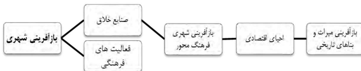
شکل ۲. سیر تحول رویکردهای فرهنگی در بازآفرینی شهری فرهنگ‌محور

– برگزاری جشنواره‌ها و فستیوال‌های فرهنگی مرتبط با میراث فرهنگی و تاریخی در راستای تشویق گردشگری فرهنگی؛ و برنامه‌ریزی و سرمایه‌گذاری در فعالیتهای فرهنگی شهری و بهره‌گیری از طراحی خلاق در راستای احیای فرهنگ شهری (Basset, 1993)