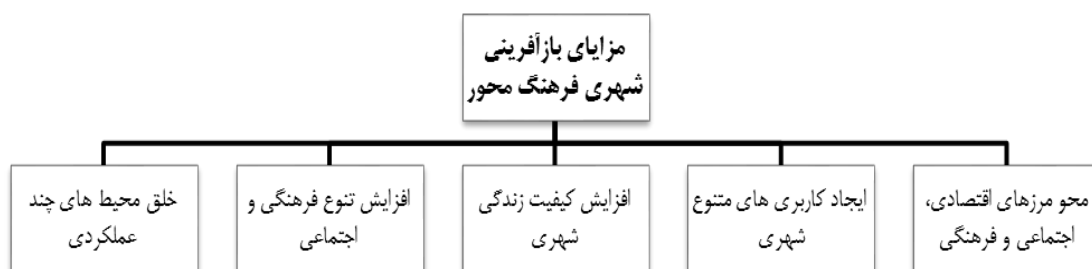
شکل ۱. مزایای بازآفرینی شهری فرهنگ‌محور

اسکات ۴ (۲۰۰۰) نیز به این موضوع اشاره دارد که گروه‌ها و کاربری‌های فرهنگی اثرات عمیق و تحول آفرین بر احیاء شهری داشته و ارتقاء و تقویت آنها، منجر به بازآفرینی شهری در مناطق تاریخی و واجد ارزش و در نتیجه افزایش کیفیت زندگی شهری خواهد شد.