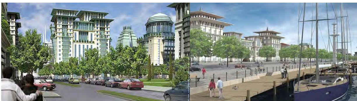
شکل ۶. پروژه بازآفرینی شهری بندر حیدرپاشا

فرایند تغییرات شهری در این منطقه بر دو محور اصلی استوار است: - جابجایی و غیرتمرکز نمودن مناطق صنعتی موجود در منطقه و به‌کارگیری و بهره‌برداری از صنایع خلاق جایگزین؛ - گسترش و تمرکز بر کاربری‌های فرهنگی، اجتماعی و خدماتی.