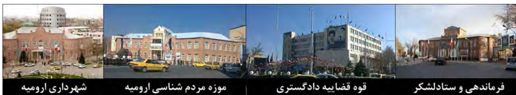
شکل ۲. میدان ایالت ارومیه