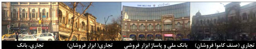
شکل ۳. میدان حسن‌آباد تهران

جای آن ساخته شد. این ساختمان متعلق به بانک ملی ایران بوده و اخیراً در پی بازسازی میدان در جلوی این نمای شیشه‌ای، سازه‌ای نمایشی شبیه به نمای دیگر بناهای میدان ساخته شد تا تمامیت فضای اولیه معماری میدان تا حدی بازگردد (شکل ۳). در ادامه و در جدول (۲ و ۳) به بررسی مدل عوامل تشکیل‌دهنده هویت مکانی در دو میدان ایالت و میدان حسن‌آباد پرداخته می‌شود.