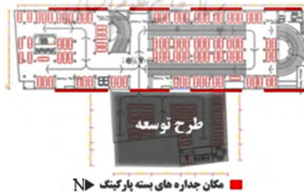
شکل ۴. طراحی بسته و متراکم در جداره‌های پارکینگ

خیابان بوعلی در مرکزیت شهر قرارگرفته که به لحاظ تراکم جمعیتی و ترافیکی در زمره پرازدحام ترین مناطق شهری جای دارد. احداث