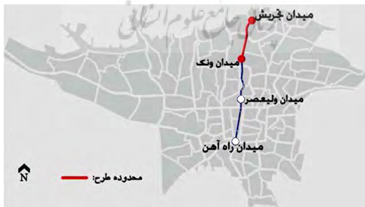
شکل ۲. محدوده مورد مطالعه

در این بخش با ۱۵۰ نفر از شهروندان مصاحبه صورت گرفت، که در آن بخشی از فرایند اخذ نقشه ذهنی طی شد، بدین صورت که از مردم خواسته شد، نام و موقعیت عناصری که بیشترین اهمیت و میزان به‌یادسپاری را برایشان داراست، روی نقشه ساده‌شده‌ای از محدوده مشخص نمایند. همچنین دلیل اهمیت و تشخیص هر نشانه را به صورت شفاهی بیان کنند. دلایل مورد اشاره توسط شهروندان، پس از اخذ، بر