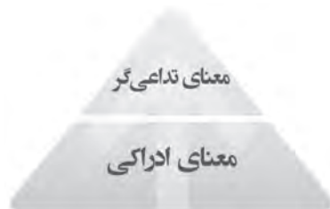
شکل ۱. سطوح معنای نشانه‌ای

از میان جنبه‌های ادراکی (دریافتی) و تداعی‌گر (یادآور) معنی محیط، معانی ادراکی با متغیرهای محیطی مؤثر بر ادراک و معانی تداعی‌گر بیشتر با حوزه اجتماعی، فرهنگی، قومی و بیولوژیکی مرتبط است (Ibid, 1990). بدین ترتیب معانی ادراکی به عنوان پیش‌زمینه معانی تداعی‌گر عمل می‌کنند. بنابراین می‌توان معنی را در سطوح مختلف و در طیف عمودی میان جنبه‌های ادراکی و تداعی کننده متغیر فرض کرده و جنبه‌های ادراکی را سطوح اولیه و جنبه‌های تداعی‌گر را سطوح عالی‌تر معنی دانست. معانی تداعی‌گر با اینکه در سطوح والاتر معنی به‌سر می‌برند لیکن از معانی ادراکی قابل فهم‌تر و ملموس‌ترند و به آسانی درک می‌شوند (شکل ۱). بنابراین اهمیت جنبه‌های تداعی‌گر معنی بسیار بیشتر از اهمیت جنبه‌های ادراکی است. وقتی یک عنصر نشانه می‌شود ابتدا به ساکن دارای معانی ادراکی است. همین عنصر وقتی در تلاقی با حوزه‌های هویتی و حافظه جمعی قرار می‌گیرند دارای معنی تداعی‌گر می‌شود که سطح پیشرفته‌تر معنی است و مفهوم نشانه معنایی همین جنبه‌های ارتقا یافته معنی محیطی از ادراکی به تداعی‌گر می‌باشد. یعنی معانی عناصر نشانه‌ای از طریق خروج از سطح ادراکی توسط متغیرهای فرهنگی و قومی-بیولوژیکی و ورود به سطح تداعی‌گر، تبدیل به نشانه معنایی می‌شود.