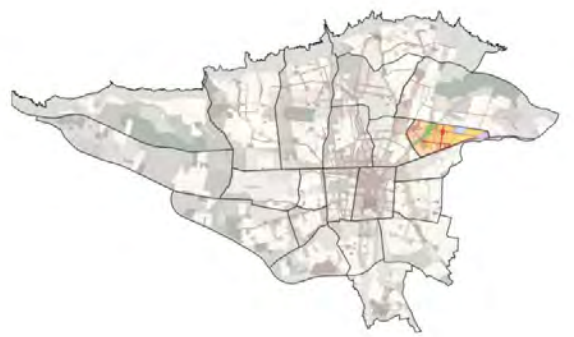
شکل ۱. موقعیت منطقه ۸ در تهران

ارتقاء کیفیت محیط از آرمان‌های شهرسازی به شمار می‌آید و لذا پرداختن به آن از اهمیت خاصی برخوردار است. در این مقاله سعی شد تا تأثیر نفوذپذیری و به‌کارگیری مناسب آن که یکی از ریشه‌ترین معیارهای کیفیت محیط به شمار می‌آید بر ارتقاء کیفیت محیط در مقیاس یک محله آشکار گردد و نقش و جایگاه نفوذپذیری عمیق‌تر از گذشته مورد توجه قرار گیرد. همان‌طور که اشاره شد نفوذپذیری از موضوعاتی است که مناقشه زیادی پیرامون آن وجود دارد و لذا اثرات مثبت و منفی آن بر کیفیت محیط می‌تواند تصمیم‌گیری‌ها را با چالش روبرو کند؛ لیکن این موضوع به کمک داشتن نگاهی نسبی و مقتضی به نفوذپذیری و مینا قرار دادن توقعات موضوعی - محتوایی در خصوص مقیاس موردنظر و توقعات موضعی - مکانی پیرامون شرایط خاص یک مکان، صورتی منطبق با شرایط به خود می‌گیرد. لذا این پژوهش درصدد بوده با پرهیز از رویکردی پیش‌داورانه ضمن توجه به محله بودن مقیاس انتخاب شده به تحلیل وضعیت نفوذپذیری و به‌کارگیری مناسب آن در جهت ارتقاء کیفیت محیط (به‌طور خاص نارمک) اقدام کند. در این راستا اصول امنیت، آسایش، آرامش، خودمانی بودن و دنجی که به‌عنوان معیارهای پژوهش و مبنای قضاوت، انتخاب و روابط زیرمعیارهای آنها با ابعاد نفوذپذیری در قالب مدل (ماتریس) روابط متقابل به نمایش درآمده بود، در قالب ۵۱ سنجه در نارمک به ارزیابی گذاشته شده و به کمک تکنیک سوات به راهبردهایی در جهت ایجاد تعادل و تنظیم نفوذپذیری بافت و سیاست‌هایی اعم از آرام‌سازی ترافیک، ترویج پیاده‌مداری، تقویت سلسله مراتب فضایی و کنترل نوع و مقیاس کاربری‌ها منتهی گردیده‌است.