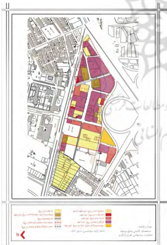
شکل ۱. نقشه مشخصات کالبدی وضع موجود

از آنجا که هدف این پروژه بررسی کارایی تحلیل‌های اقتصاد مهندسی در تحقق‌پذیری طرح‌های شهرسازی است؛ لذا انتخاب این پروژه به‌طور نمونه و ارزیابی آن می‌تواند جهت ارزیابی و طراحی اقتصادی (سودآور نمودن طرح) سایر پروژه‌های مشابه به عنوان الگو و روش انجام کار مورد استفاده واقع شود.