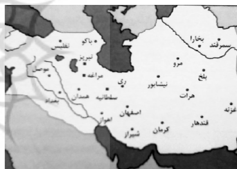
شکل ۲. قلمرو حکومت ایلخانان در زمان اولجایتو (مأخذ: محمدپناه، ۱۳۸۷، ۴۶)

مغولان با چنین فرهنگ دینی به ایران سرازیر شدند و حتی پس از تغییر دین، هنوز بسیاری از اعتقادات و آداب و رسوم قبلی خود را حفظ کرده بودند. دلایل و شواهد متعددی در این زمینه وجود دارد. به عنوان مثال تقدس درخت، دخیل بستن به آن و پایکوبی در اطراف آن از رسومی است که همواره با مغولان بوده است و غازان خان که مسلمانی متعصب و پایبند به اصول اسلام بود، این رسم را به‌جا می‌آورد (فضل الله همدانی، ۱۳۵۸، ۱۴۱). اقبال آشتیانی پایبندی به یاسای چنگیزی و نیز تألیف کتب تاریخی توسط حاکمان مغولی درباره مغولان همچون «جامع التواریخ» را دلیلی بر علاقه مغولان به زنده نگاه داشتن آداب مغولی می‌داند (اقبال، ۱۳۷۹، ۵۵۷). آنها همچنین سنت کوچ نشینی خود را با انتخاب پایتخت‌های تابستانی و زمستانی برای خود ادامه داده و باعث پیدایش نوعی فرهنگ خاص در تقابل با آداب شهرنشینی ایرانیان شدند (شراتو، ۱۳۸۴، ۱۳؛ Soucek, 1990, 362). (شکل ۲)