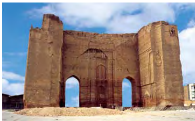
شکل ۵. ارگ علیشاه

تعبیر شود. کوهی که جایگاهی نمادین و بسیار با ارزش در آیین شمنی مغولان و عرفان ایرانی - اسلامی داشته است.