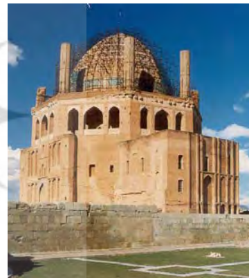
شکل ۴. آرامگاه اولجایتو (گنبد سلطانیه)

متهورانه‌ترین ابتکار معمارانه در این ساختمان، یعنی ابتکاری که می‌توانست زمینه ساز امکانات بسیار در آینده شود، تاج یا حلقه‌ای متشکل از هشت مناره است که گنبد را همچون نگینی در بر گرفته‌اند (هیلن براند، ۱۳۷۴، ۹۴). این مناره‌ها می‌توانستند نیروی رانشی وارد شده از گنبد به دیوارها را تا حدودی خنثی کنند اما نباید وجود آنها را صرفاً به خاصیت سازه‌ای آنها نسبت داد. دیوارهای ستبر این بنا به ضخامت هشت متر قطعاً تحمل نیروهای وارده از جانب گنبد را داشته‌اند زیرا در دوره‌های بعد با اینکه مناره‌ها در اثر فرسایش تقریباً به‌طور کامل از بین رفته‌اند ولی ساختار کلی بنا محکم و استوار پابرجا مانده و از هم نپاشیده است. در ضمن معماران ایرانی قبلاً در ساخت مقبره سلطان سنجر در مرو به سال ۵۵۲ هجری تجربه مشابهی را - البته بدون وجود مناره‌های اطراف گنبد - با موفقیت از سر گذرانده بودند.