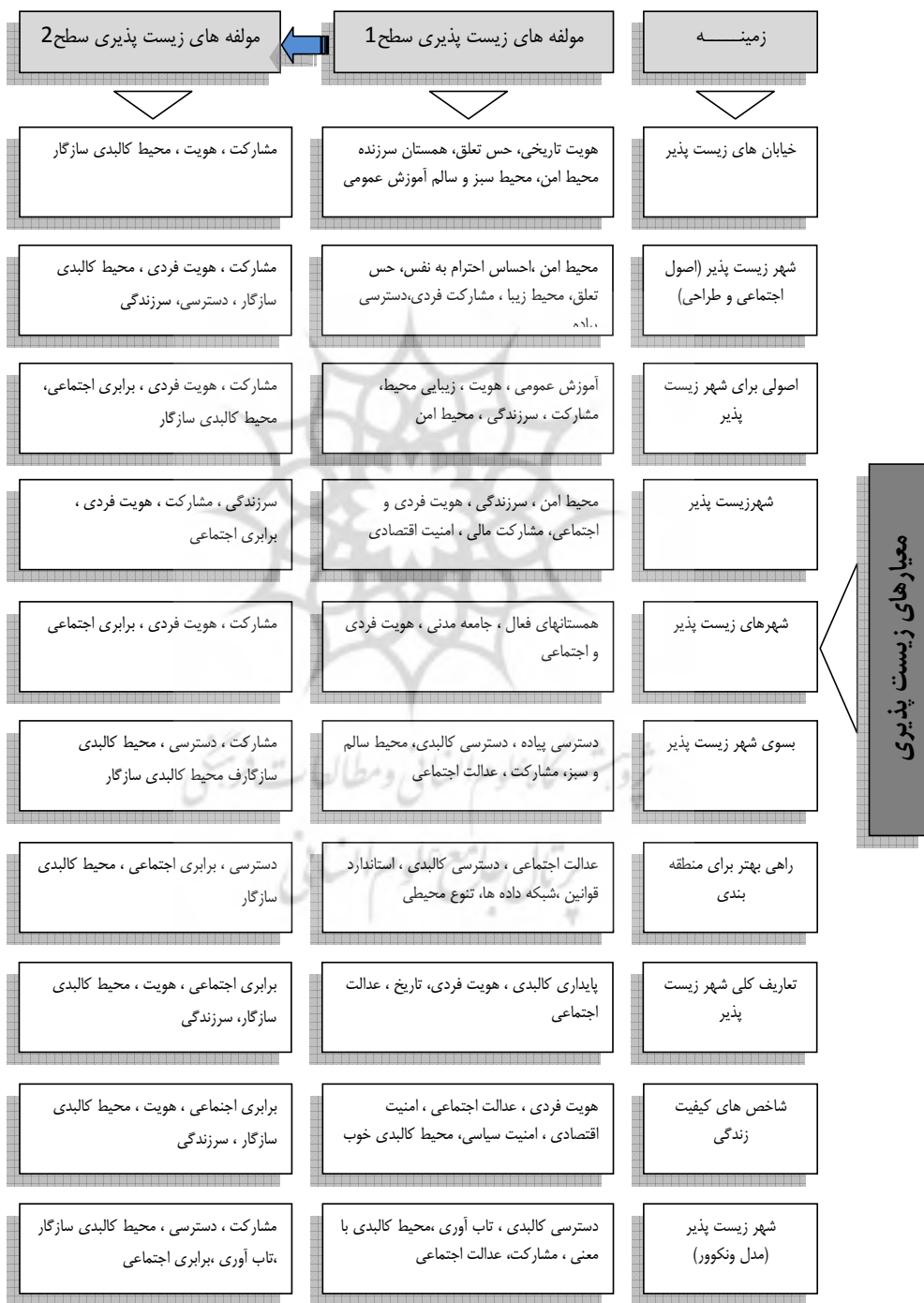
شکل ۱. تحلیل قیاسی معیارهای زیست پذیری برای دستیابی به مدل مفهومی

به نظر می رسد. از دیدگاه «مرسر» اصطلاح کیفیت زیست ۳۴ با اصطلاح کیفیت زندگی متفاوت است و در واقع منظور مرسر کیفیت زیست بوده و این شاخص ها به صورت عینی، خنثی و بدون تعصب بیان شده اند. کیفیت زندگی درباره حالت احساسی شخص و زندگی