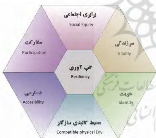
شکل ۲. مدل مفهومی پیشنهادی؛ مولفه های تشکیل دهنده زیست پذیری

در این تحقیق ضمن بررسی شاخص های مطرح شده در زمینه های زیست پذیری و ارتباط میان مفاهیم مشابه در شهرسازی و مفهوم زیست پذیری، از طریق رمزگذاری نظری و تحلیل محتوا سعی در شکل دهی انتظام مباحث در قالب مدل گردید. اکنون مدل مفهومی شهر زیست پذیر یعنی مولفه های شش گانه زیست پذیری در قالب یک مفهوم شناور قابل پیشنهاد است. مسأله با اهمیت دیگر این است که در کنار زیست پذیری مولفه دیگری وجود دارد که در ارتباط مستقیم با آن قرار گرفته و از آن پشتیبانی می کند. این مولفه همان گونه که در بخش های پیشین نیز اشاره شد «تاب آوری» نام دارد و می تواند در کنار ۶ مولفه فوق به عنوان مولفه پشتیبان یا فوق مولفه شناخته شود. طبیعتاً شهری که در مقابل بلایای طبیعی یا بحران های مختلف تاب آور نباشد، از قابلیت زیست پذیری چندانی برخوردار نخواهد بود. بحث تاب آوری هم به لحاظ پشتیبانی مولفه های زیست پذیری و هم پشتیبانی از مولفه های شکل شهر حائز اهمیت بوده و به نظر می رسد که نقش آن در خلق فرآیند زیست پذیری غیرقابل انکار است. بنابراین مدل مفهومی مورد نظر در قالب ۶ مولفه و یک فوق مولفه یا مولفه پشتیبان مطابق شکل ۲ خواهد بود.