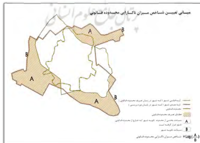
شکل ۲. مبانی تعیین شاخص «میزان ناکارایی حدود رشد شهری»