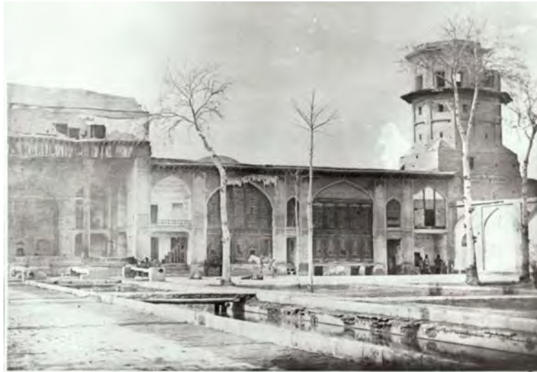
شکل ۳. دیوان‌خانه جدید یا ایوان نادری (کاخ چهلستون) و برج کبوتر. شکل مربوط به اوایل قاجاریه ۹ .

اشخاص معدودی می‌توانستند آن جا بنشینند و از هوای خنک و فرح بخش باغ استفاده کنند» (دلاواله، ۱۳۴۸، ۳۱۱ و ۳۱۲). برای تعیین محل استخر به توصیفات همراهان دن گارسیا د سیلو فیگوئورا سفیر اسپانیا باید توجه نمود: «... راهنمایان در وسط خیابان به سمت راست پیچیدند و سفیر را به خیابانی کوتاه تر اما باز هم پر درخت راهنمایی کردند. در انتهای این خیابان پر درخت استخری زیبا و بسیار بزرگ بود به مساحت یکصد و پنجاه پای مربع و در وسط آن دفتر کاری خوش ساخت که از همه طرف باز بود و جز یک غرفه که به وسیله‌ی چهار ستون بزرگ چوبی برپا بود جایی نداشت. راه ورودی این دفتر دالان یا پل سرپوشیده‌ای بود به پهنای چهار پنج پا و جان پناهی در دو طرف» (دسیلو فیگوئورا، ۱۳۶۳، ۲۶۵). با مقایسه تطبیقی توصیف مورخان به احتمال قوی بنای شاه گلی تبریز الگوی استخر بزرگ بوده است. بنای استخر بزرگ به طور تقریبی جانمایی شده و با حرف (D) در طرح بازآفرینی مشخص شده است.