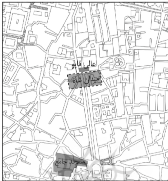
شکل ۱. محل میدان شاه در نظریه اول