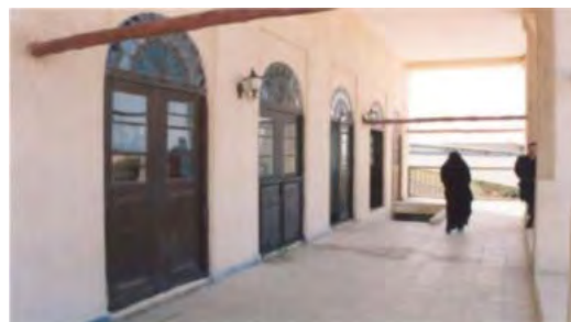
شکل ۱۷. هدایت باد توسط ایوانها. بافت قدیم بوشهر - محله بهبهانی