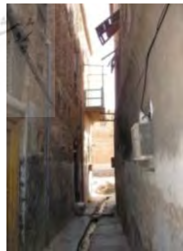
شکل ۳. شرایط اقلیمی در شکل‌گیری کانون‌های زیستی نقش اساسی دارند. کوچه در محله کوتی بوشهر