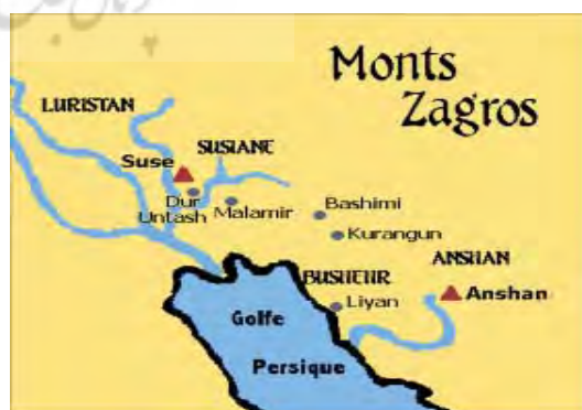
شکل ۱. خلیج فارس و شهر باستانی لیان «بوشهر امروزی» در دوره ایلامیان