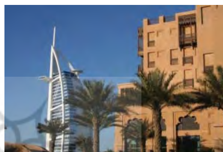
شکل ۲۵. دبي - جميره ، نماي هتل ميناالسلام