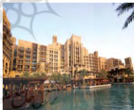
شکل ۲۷. دبي - جميره، نماي هتل جديد ميناالسلام، معماری بر

گرفته از بافت قديم بستکيه با استفاده از مصالح نو