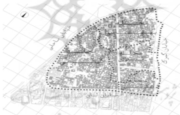
شکل ۵. چهار محله بافت قدیمی بوشهر ۸

سیمای عمومی بافت قدیم بوشهر، واجد انسجام و یکپارچگی خاصی است. بناهای مختلف در این محدوده، با وجود تفاوت‌هایی که با