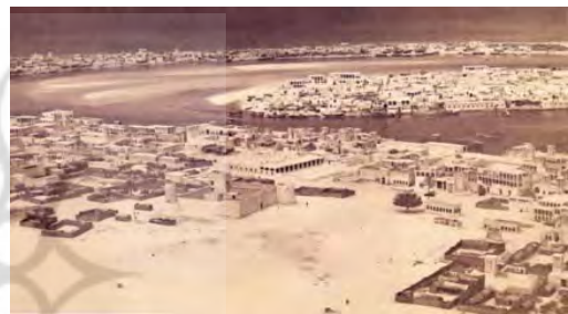
شکل ۲۱. دبی قبل از تحولات سال ۱۹۵۰

است. برای تهویه خانه ها از بادگیرها که عنصر برجسته معماری ایرانی است استفاده شده است. کوچه های تنگ و باریک میان بناهای ساخته شده فاصله انداخته و با توجه به ارتفاع بلند آنها کوچه های باریک از نعمت سایه نیز برخوردارند (شکل ۱۹ و ۲۰).