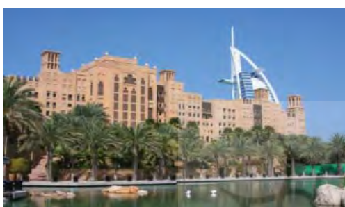
شکل ۲۶. دبي - جميره ، نماي هتل ميناالسلام و برج العرب. سنت ومدرن