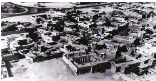
شکل ۲۴. بافت متراکم محله بستکيه در دبي و باد گيرهايي که توسط مهاجرين ايراني ساخته شده است