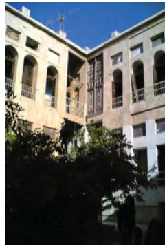
شکل ۱۵. بازشوها در جداره داخلی. بافت قدیم بوشهر. محله کوتی. خانه دهدشتی

قرار می دهد» می باشد. در خانه های بافت قدیم بوشهر تمامی فضاهای داخلی کم عرض و یک لایه بوده و دارای پنجره های رو به روی هم می باشند. بنابراین تهویه در فضاهای بسته داخلی به خوبی امکان پذیر بوده و شرایط مناسبی در داخل برقرار است. وجود تارمه ها و ایوان های وسیع در به داخل کشاندن باد مطلوب و ایجاد تهویه داخلی سهم مؤثری دارند. وجود حیاط ها امکان نورگیری را به فضاهای درونی میسر می سازد. در نهایت کرکره های چوبی نقش به سزایی در جلوگیری از تابش شدید آفتاب و پالایش آن را دارند (شکل ۱۷ و ۱۸).