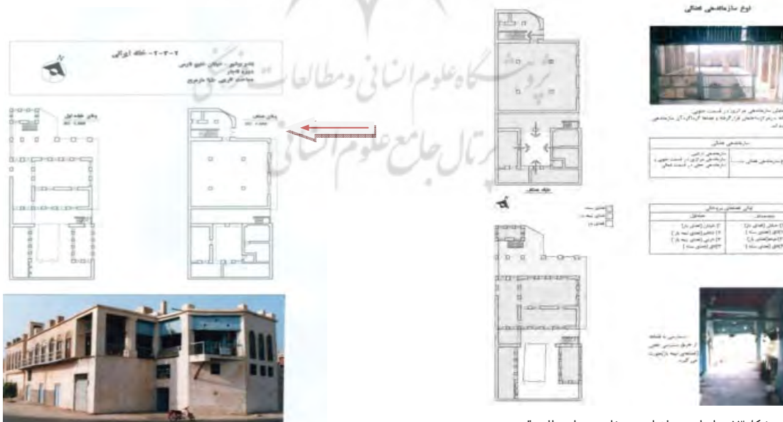
شکل ۱۳. سازماندهی فضایی در خانه مهربان، بافت قدیم بوشهر. محله بهبهانی

در معماری بافت قدیم بوشهر که هم درونگرا و هم برونگراست، نقش ورودی در حفظ حریمیت به لحاظ مسائل فرهنگی و اجتماعی، و ایجاد جزرها و فرورفتگی ها نسبت به دیگر عناصر معماری بافت کم رنگ تر به نظر می رسد. استفاده از کرکره های چوبی، حصیرهای آفتابگیر و تغییر جهت پلان، ضمن دعوت از کوران باد و جلوگیری از ورود مستقیم آفتاب جلوی دید مزاحم را می گیرد. ورودی مستقیماً از خیابان «عرصه