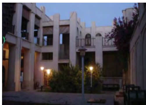
شکل ۱۱. فضای باز مرکزی - حیاط

عمومی» به دالان ورودی بنا «فضای نیمه خصوصی» صورت گرفته و سپس با چرخشی ورود به حیاط و فضای خصوصی «اتاق ها» را مؤثر می سازد. فضای ورودی و مکث به صورت فضایی دالانی شکل است که عرصه نیمه خصوصی این بناها را تشکیل می دهند (شکل ۱۴).