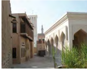
شکل ۲۹. دبی، جمیره، نمای هتل، استفاده از عناصر معماری بافت قدیم (شناشیر) تراس چوبی در نمای هتل میناالسلام