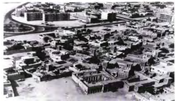
شکل ۱۹. محله البستکیه دبی