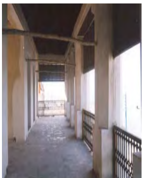
شکل ۱۲. شکل مسیر حرکتی در طبقات