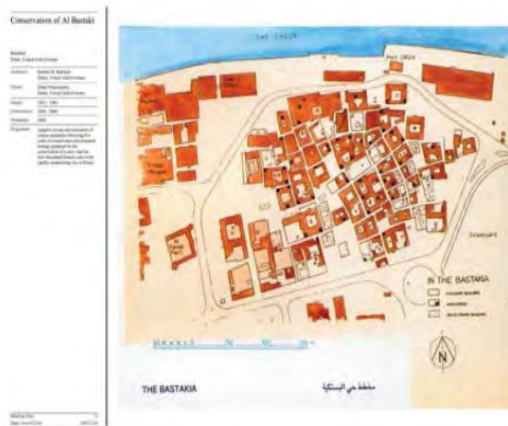
شکل ۲۰. بافت محله بستکیه