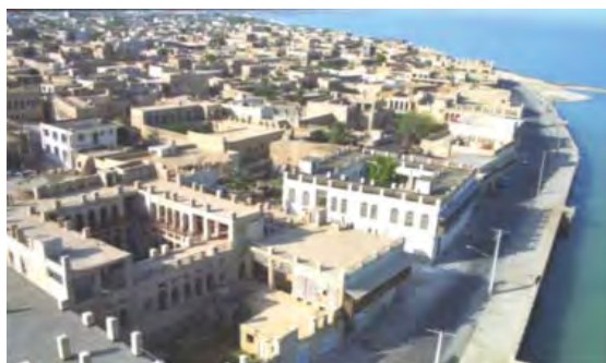
شکل ۶. سیمای بافت از سمت دریا نمایانگر یکپارچگی در تراکم و تعداد طبقات است ۹