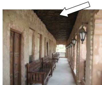
شکل ۲۳. پوشش سقف اتاقها از چوب « چندل » و حصير. محله بستکيه - دبي