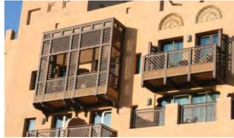
شکل ۳۰. دبی، محله بازسازی شده بستیکه

گردشگری و جذب توریست محله قدیمی البستیکه را بازسازی نمودند. با این هدف و در پی یافتن هویتی معمارانه تلاش نمودند در طراحی و ساخت بناهای جدید در دبی از عناصر و معماری گذشته کشور ما استفاده نمایند. نشانه‌هایی از تأثیر فرهنگ و عناصر معماری ایرانی (بادگیرها و بسیاری عناصر دیگر که به آن‌ها اشاره شد) در طراحی و ساخت این بناها دیده می‌شود. هتل میناالسلام در دبی نمونه‌ای بارز و دیدنی از این نوع معماری است.