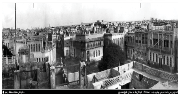
شکل ۱۰. بافت بوشهر از بلوک های کوچک تک خانه ای سازمان یافته

بافت قدیم مانند سایر شهرهای جنوبی کشور از بلوک های کوچک تک خانه ای ساخته شده است. این روش کمک می کند جریان هوا از کوچه های باریک بگذرد و نسیم خنکی برای عابر پیاده به ارمغان آورد.