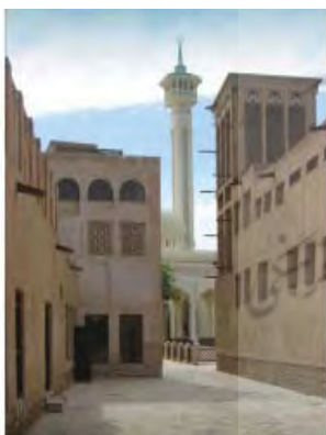
شکل ۲۸. دبي ، محله بازسازي شده بستکيه