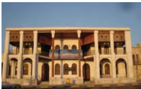
شکل ۱۸. پنجره های بزرگ خارجی با بازشوهایی در قسمت فوقانی برای تهویه فضاها. بافت قدیم بوشهر. محله کوتی - ساختمان امیریه

با توجه به شرایط اقلیمی حاکم بر منطقه و دریا، باد یکی از عوامل مؤثر منطقه است و در تعیین موقعیت عناصر شهری و جهت گیری مناسب مسکن نقش به سزایی دارد. بنا بر این جهت گیری تمام خانه های این منطقه به سمت باد غالب « بادی که از شمال غرب و در جلگه های دجله و فرات در حرکت بوده و سواحل خلیج فارس را تحت تأثیر خود