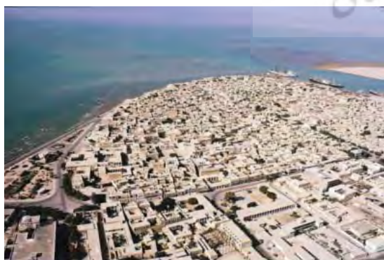
شکل ۲. خلیج فارس و تجارت نقش مهمی در بوجود آمدن بافت زیبای بوشهر داشته است

بوشهر با بافت بندری ویژه در جنوب ایران و مرکز خلیج فارس، از ارزش جهانی برخوردار است و این ارزش تاریخی - فرهنگی وابسته به معماری بومی و طبیعت گرایانه شهرسازی و معماری این بافت شهری است که آن را در مقام یک اثر هنری قرار داده است. بنابراین شناخت بافت بوشهر، جهت تقویت هویت بومی منطقه و کاربری های فرهنگی و تفریحی و ابقای گونه های با هویت موجود امری ضروری است. در این راستا نخست نقش تاریخی خلیج فارس در بوجود آمدن شهرهای کرانه ای و سپس به عوامل تأثیرگذار در شکل گیری معماری بافت قدیم بوشهر و نقش مکتب اصفهان در معماری بافت پرداخته شده است و در ادامه ارزش های معماری بافت قدیم بوشهر و تأثیر آن بر معماری کشورهای حاشیه خلیج فارس به ویژه محله البستکیه در پرداخته شده است.