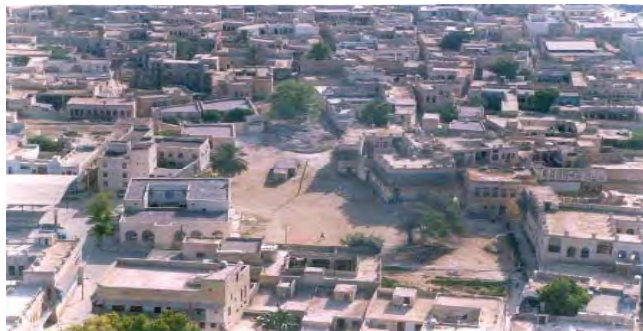
شکل ۹. ارتباط خانه ها و مراکز محله. بافت قدیم بوشهر. محله کوتی ۱۲

حد فاصل بلوک ها کوچه های باریک است که مرتباً با یکدیگر ارتباط پیدا می کنند. کوچه های باریک و تنگ در نهایت به فضای گشادتری به نام میدانچه ختم می شوند. این فضای باز را می توان مهم ترین عنصر در سازماندهی فضای شهری و بافت نامید (شکل ۱۰).