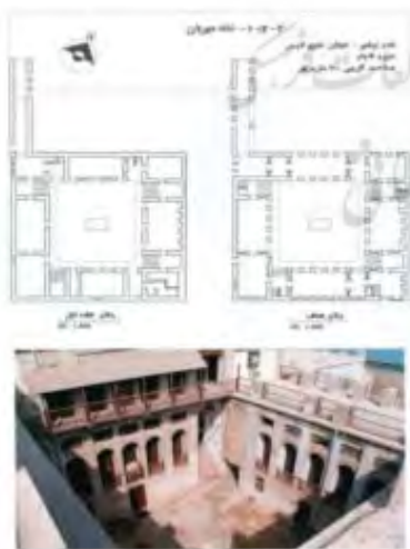
شکل ۴. خانه مهربان: اقلیم نقش مؤثری در شکل‌گیری بافت داشته است

شناخت هر پدیده به میزان شناخت فرآیند تاریخی آن پدیده بستگی دارد. نحوه شکل‌گیری پدیده و عناصر مؤثر در آن را باید کشف نمود و سپس طی زمان مورد بررسی و تحلیل قرارداد. آنچه در این فرآیند مهم است درک درست از شرایط عام و شرایط خاصی است که بر تحول پدیده و سیالیت آن مؤثر است. بررسی‌های متون به جا مانده، چه در مقیاس کشور، چه در مقیاس جهانی - و مطالعات صورت گرفته در کشور در زمینه چگونگی شکل‌گیری کانون‌های زیستی - به معنای عام کلمه و در شهر به معنای اخص کلمه چند عامل اصلی را روشن می‌سازد. این عوامل را می‌توان به گونه‌ای کلی و عمده در سه گروه عنوان نمود: - جهان بینی یا چگونگی نحوه نگرش به جهان: این عامل، دین،