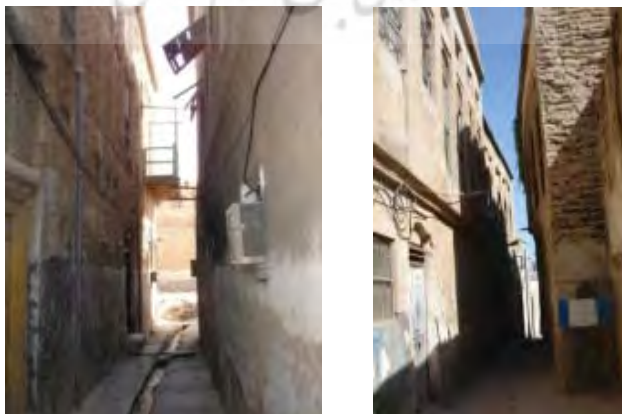
شکل ۸- کوچه در بافت قدیم بوشهر- محلله کوتی

ساختار کالبدی بافت قدیم بوشهر طی زمان و با گسترش شهر شکل گرفته است. فضاها و عناصر شهری هر کدام در جای مناسب خویش استقرار یافته و یا ایجاد شده است. بافت کالبدی شهر بوشهر و مناسبات