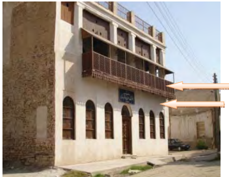
شکل ۱۶. بازشوها در جداره بیرونی، شناشیر، سایبان، بافت قدیم بوشهر. محله کوتی