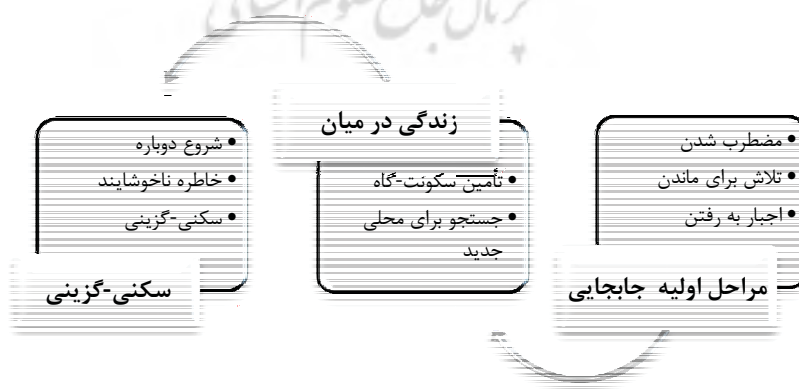
نمودار ۲. کیفیت های زیسته در یک تغییر مکان اجباری، مأخذ: (Million, 1992, 8)

مضطرب شدن ۴ ، تلاش برای ماندن ۵ و مجبور شدن به رفتن ۶ مراحل اولیه این جابجایی هستند که خانواده ها می فهمند باید کاشانه خود را ترک کنند. تأمین سکونت گاه و جستجو برای محلی جدید، مراحل بعدی است که معرف "زندگی در میان" ۷ است و آن زمانی است که خانواده احساس دوری از مکان خود می کنند. در نهایت، با شروع دوباره، یادآوری ناخوشایند و سکنی گزینی خانواده ها به مرحله ساخت مجدد می رسند. این مطالعه از آنجایی که اساس تجربه مکانی را برای گروهی از مردم که مکان خود را از دست داده اند و تلاش می کنند دوباره سکنی گزینند، حائز اهمیت است. (Million, 1992, 8)