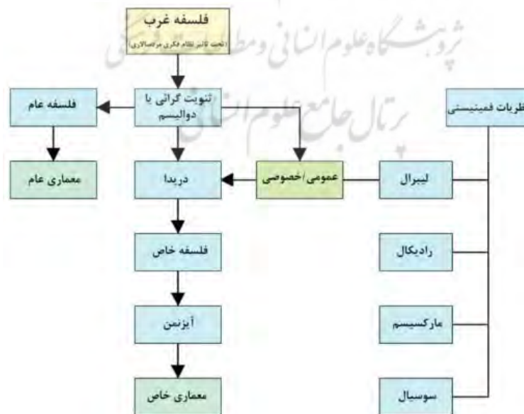
شکل ۱. نمودار ارتباطی بین فمینیسم و معماری

حوزه خصوصی را در زیست شناختی می دانند و معتقدند چون زنان به صورت نمادین همواره تداعی گر طبیعت بوده اند و طبیعت تحت سلطه مردان است لذا زنان به قلمرو تحت سلطه (حوزه خصوصی) تعلق دارند. براساس نظریات این گروه، قلمروهای عمومی و خصوصی دو دنیای جداگانه نیستند بلکه عرصه های تاثیر متقابل هستند و رابطه میان این دو عرصه متغییر و نیازمند بررسی می باشد. (کاظمی، ۱۳۸۶) در حقیقت آنچه محل بروز اشکال در تفکیک عرصه ها می شود ریشه در ثنویت گرایی ۱۵ دارد که با اندیشه های مبتنی بر تقابل های دوتایی یا همان نظام های فکری دو ارزشی دارای ارتباط تنگاتنگ است. از دیدگاه فمینیستی، ثنویت گرایی به معنای ساختن جهان برمبنای تقابل دوگانه سفید/سیاه، خوب/بد، عمومی/خصوصی و زن/مرد و مانند آن است که در بطن نظام مردسالاری است و فلسفه غرب کماکان زیر سیطره این دیدگاه قرار دارد. از میان کسانی که ثنویت گرایی را به چالش کشیدند می توان به ویتگن اشتاین ۱۶ و ژاک دریدا ۱۷ اشاره نمود. دریدا نقطه اتصالی بین نظریات فمینیسم لیبرال و معماری می باشد (شکل ۱) در حقیقت تلویح ضمنی درون کار فمینیست هایی نظیر "سوزاناتوری" ۱۸ (Torre, 2000, 140)، "الیزابت ویلسون" ۱۹ (Wilson, 2000, 146) و "گریسلدا پولاک" ۲۰ (Pollak, 2000, 154) را به عنوان واسازی ۲۱ تضاد ۲۲ مذكر / مونث از حیطه های جداگانه، استراتژی هایی هستند که به عنوان بخشی از پروژه روشنفکرانه ژاک دریدا فیلسوف فرانسوی می باشند. کسی که هدفش ارایه راه هایی بوده است که به جای جایگزین