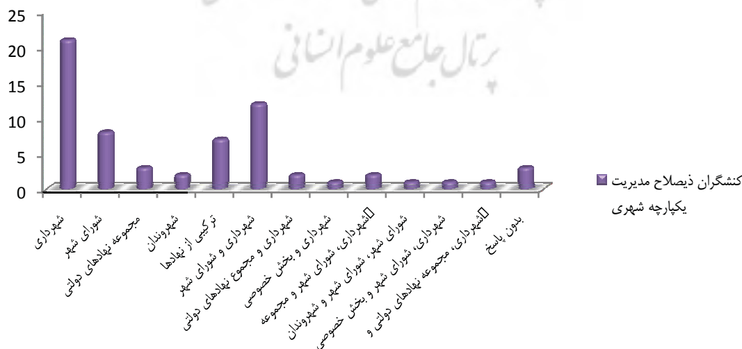
نمودار ۳. کنشگران ذی صلاح مدیریت کلانشهر تهران

شرکت کنندگان در تحقیق کنونی بر این باور هستند که شهرداری با درصد فراوانی ۱۸/۸ بیشترین اهمیت را در مرحله برنامه ریزی برای امور شهری دارد. شرکت کنندگان در تحقیق کنونی بر این باور هستند که پس از شهرداری، شورای شهر با درصد فراوانی ۱۵/۶ از بیشترین اولویت در زمینه فعالیت برنامه ریزی امور شهری برخوردار است. در