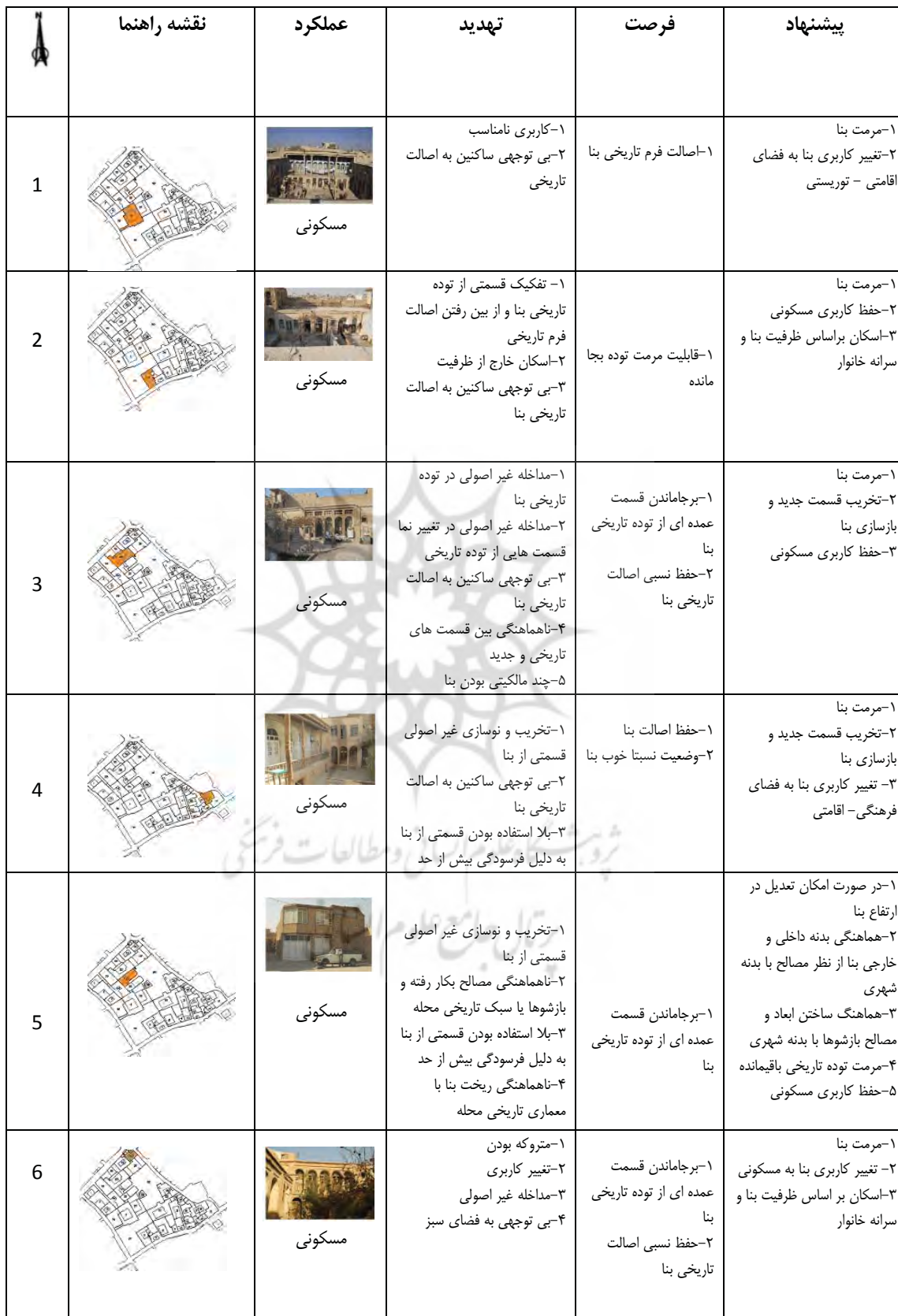
جدول ۹. تحلیل نقاط ضعف و قوت بنا