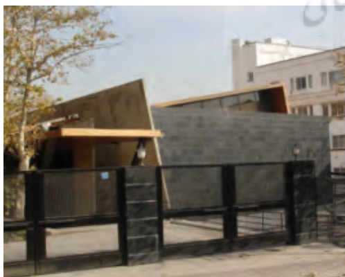
شکل ۱۲، مجموعه چند منظوره زعفرانیه

گرایش به معماری ساختار زدا فقط در فرم بیرونی: در این نوع از بناها ساختار فضایی عملکردگرا و کاملاً مدرن است و نما شکلی ساختارزدا دارد. در حقیقت در این روش مکعبی مدرن ترسیم می گردد و سپس با تغییر ساختار اجزایی از آن مثلاً مورب کردن سطح یکی از اضلاع به عمق کم و تکرار این جریان در قسمتهای مختلف به همراه استفاده از مصالح رنگی نمایی ساختار زدا روی ساختاری مدرن ایجاد می گردد.