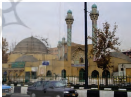
شکل ۳. مسجد دانشگاه شریف