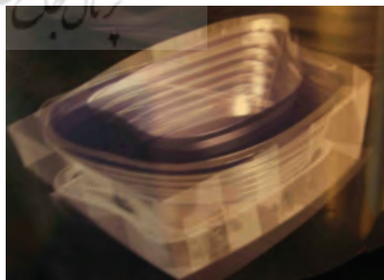
شکل ۱۱، دفتر همکاریهای فناوری ریاست جمهوری