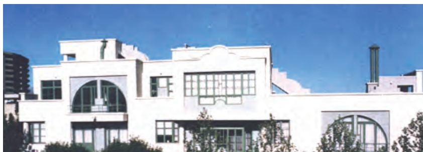
شکل ۸. ساختمان مسکونی