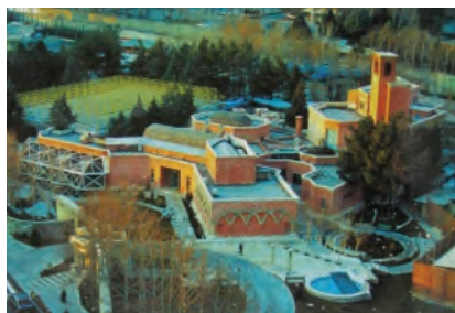
شکل ۱.

دقیق مجموعه ای از پیام ها به صورت کمی است.