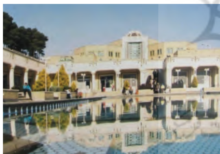
شکل ۴. فرهنگستان خاوران ماخذ: نگاهی به مهندسی ساختمان و معماری معاصر ایران، ۱۶۰