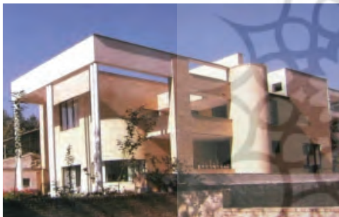
شکل ۶. خانه افشار

و برداشت سودجویانه از دیدگاه مدرنیسم گردید. در این روش فقط با ساخت دیوارهای ساده آجری و زدن سقفی روی آن و شیشه کردن از کف تا سقف، ساختمانی شبه مدرن ایجاد می گردد که قابلیت قرارگیری در هر کجایی را نیز دارد. از آنجا که همواره سازندگان و کارفرمایان دولتی و خصوصی به دنبال طرح های سهل الحصول و اقتصادی (به زعم خودشان) و یا به طور خلاصه مترائ ساخته شده قابل تبدیل به سرمایه آنی هستند، نه نوآوری، ابداع و تفکر، لذا سهل ترین حالت ممکن همان مکعب سازی مدرن و نهایتاً کشیدن پوسته ای شیشه ای یا سنگی متداول بر آنها می باشد. سهولت اجرا، ارزان تمام شدن قیمت ساخت، تالو و جذابیت بصری نما (انعکاس محیط در شیشه های انعکاسی) این نوع از بناها را به نمونه ای مطلوب جهت کارفرمایان خصوصاً برای ساختمان های تجاری تبدیل کرده است. غالب ساختمان های اداری و تجاری ساخته شده در تهران که در غالب معماری مدرن قابل شناسایی اند در گروه مدرن سطحی قرار می گیرند.