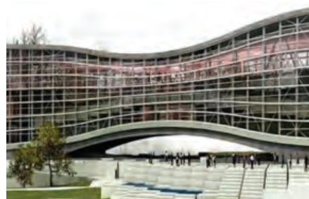
شکل ۹. سینما ملت.