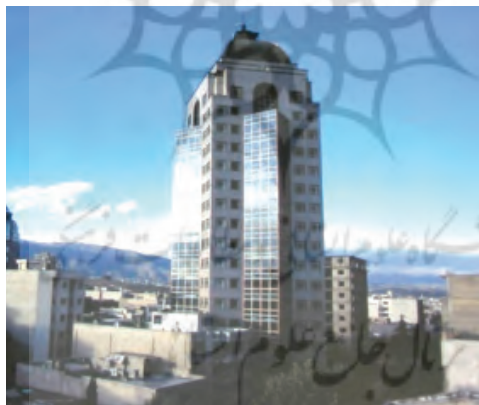
شکل ۷. برج اداری آرمیتا

اقتباس از فرم هایی نظیر گنبد، یخچال، بادگیر، حیاط مرکزی، گودال باغچه، زیگورات. در این زمینه دو گروه از بناها ایجاد گردیده اند. • گروهی که از فرم های معماری تاریخی علاوه بر استفاده صوری، استفاده کارکردی نیز شده است. مانند فرم حیاط مرکزی و گودال باغچه که در صورت به کار رفتن در بنایی عملکرد خود را نیز به انجام می رساند. ۵ • گروهی که از فرم های معماری تاریخی صرفاً استفاده صوری شده است. مثل بناهایی که فرم بادگیر در طرح آنها به کار رفته، اما استفاده کارکردی تهویه از آن صورت نمی پذیرد. ۶