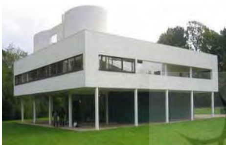
شکل ۳- ویلا ساوا، فرانسه؛ معماری مدرن و مکعب‌های بی‌روح

نیازهای فرهنگی، اجتماعی نهاد یافته گرفته شد. از دیگر ویژگی‌های این دوران ادعای جهانی مدرنیته بود که سر نزاع با تمام خرده هویت‌های موجود در جهان با آن همه سابقه تاریخی داشت (قطبی، ۱۳۸۷، ۸۰) و همواره در پی «بافتن هویت ویژه برای جهانیان» بود. از این رو عصر مدرن به «عصر ایدئولوژی آفرین» (قبادیان به نقل از رهنورد، ۱۳۸۳، ۹۲) شهرت یافت. انتخاب این لقب برای این دوره دلیلی بر رواج بی‌هویتی و یا به تعبیر بهتر گسترش هویت جهانی دارد. در این دوران قراردادهای اجتماعی مبنی بر نظر اکثریت جایگزین اصول ابلاغ شده الهی در دیدگاه سنتی شدند (شکل ۳).