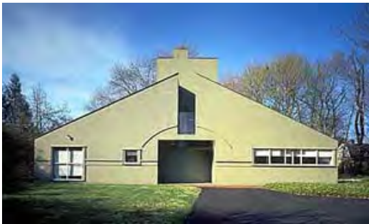
شکل ۴- خانه مادر ونچوری، فیلادلفیا؛ معماری پست مدرن و بکارگیری نماد در ساخت بنا.