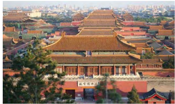
شکل ۲- شهر ممنوعه چین؛ معماری متأثر از عوامل اقلیمی و فنی و بیش سنتی.

(همان، ۶۰) تعبیر می‌شود. آنچه امروز از شهر سنتی مشهود است، بافته پر مایه ایی از صور با انسجام شهری است که به معنای ژرف وحدت در کثرت و حس وحدت در میان پراکندگی شباهت دارد (اردلان و همکاران، ۱۳۸۰، ۱۲۶) (شکل ۲).