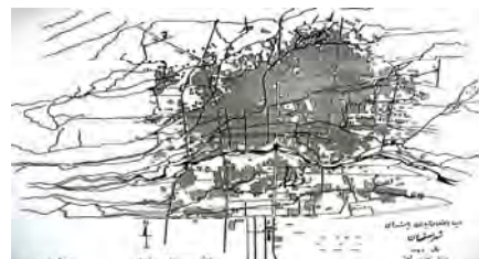
تصویر ۲- نقشه مادی‌ها (کانال‌های آبیاری) و چشمه‌های شهر اصفهان