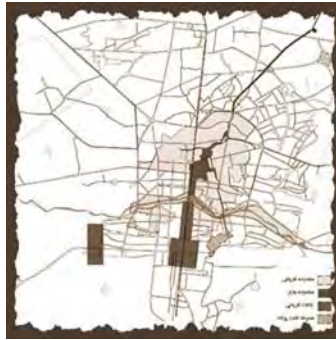
تصویر ۵- تأثیر زاینده رود و انشعابات آن بر بافت شهر اصفهان

اغلب مادی‌ها با عبور از بافت تاریخی شهر اصفهان ضمن تأثیری که بر بافت و محدوده اطراف خود گذاشته‌اند، از ویژگی‌های کالبدی، تاریخی و اجتماعی محل عبور خود تأثیر پذیرفته‌اند. به طوری که یک مادی با گذر از محله‌های مختلف که ویژگی‌های اجتماعی و فرهنگی متفاوتی داشته در هر قسمت رنگ و طرح ویژه‌ای را در بدنه خود نمایان ساخته است (تصویر شماره ۵).