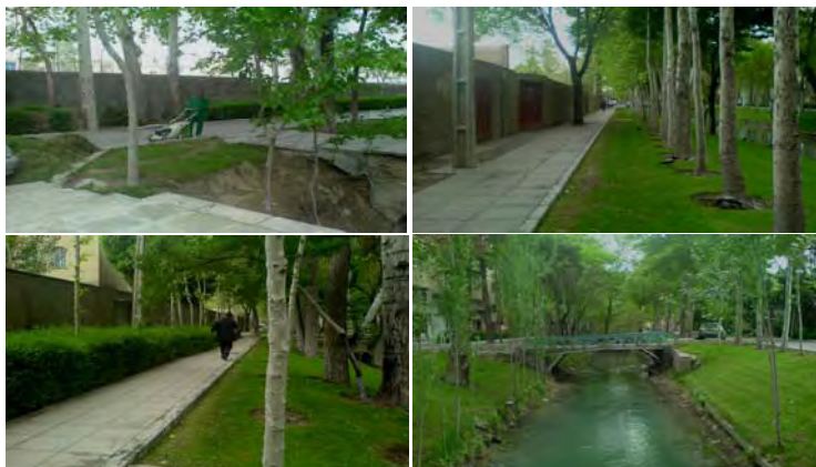
تصویر ۸- نمونه هایی از طرح اجرا شده در حاشیه مادی نیاصرم