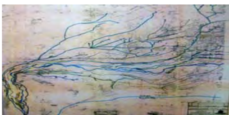
تصویر ۳- نحوه حرکت مادی‌ها در شهر؛ مادی‌ها چون شریان‌های حیات‌بخش در سطح شهر اصفهان پراکنده شده‌اند.