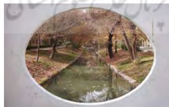
تصویر ۱- تصاویری از مادی نیاصرم؛ زیباترین و پرآب‌ترین مادی شهر اصفهان