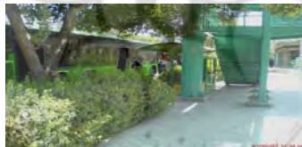
تصویر ۹- پاره ای از اقدامات صورت گرفته در چشمه باقرخان: نصب تابلو، استقرار ایستگاه اتوبوس، اصلاح شیب جانبی