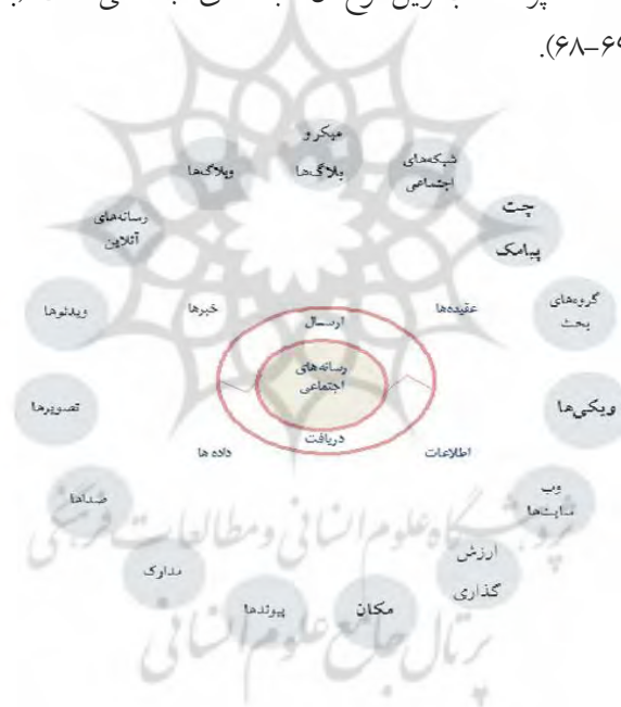
شکل شماره ۲. نقشه رسانه‌های اجتماعی (بصیریان جهرمی و همکاران، ۱۳۹۲: ۶۹)

است رسانه اجتماعی هدایت‌کننده رویدادهای آینده برای گفت‌وگوست (مسن کر، ۱۳۹۵: ۶۶). آندریس کاپلان ۱ و مایکل هیلین ۲ رسانه اجتماعی را مجموعه‌ای از برنامه‌های کاربردی مبتنی بر اینترنت می‌دانند که بر پایه فناوری‌ها و ایدئولوژیکی وب ۲ پی‌ریزی شده‌اند و امکان ساخت و تبادل محتوای تولیدشده از سوی کاربر را فراهم می‌سازند (Kaplan & Haenlein, 2010: 60). این رسانه‌ها انواع گوناگونی دارند و اهداف مختلفی را دنبال می‌کنند. مارسل برنت در کتاب «رسانه‌های اجتماعی و کسب‌وکار رسانه‌ای» که در ۲۰۱۰ منتشر شد، چهار جریان (عقیده‌ها، خبرها، اطلاعات و داده‌ها) را در تعامل (ارسال و دریافت پیام) بر بستر رسانه‌های اجتماعی مؤثر می‌شمارد. شکل شماره ۲ نقشه رسانه‌های اجتماعی را در ۱۵ گونه مختلف نشان می‌دهد که پرمخاطب‌ترین نوع آن شبکه‌های اجتماعی است (بصیریان جهرمی و همکاران، ۱۳۹۲: ۶۹-۶۸).