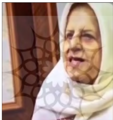
پژوهشگاه علوم اطلاعات فرهنگی تصویر ۱۵

در بیشتر صفحه‌های اجتماعی زنان سیاستمدار، هیچ تصویر و اشاره‌ای از خانواده و خانه دیده نمی‌شود. ابتکار در میان این زنان، تنها تصویر مادر خود را منتشر کرده است (تصویر ۱۵). در این تصویر، پوشش مادر ابتکار، برخلاف دخترش که اغلب در انظار و تصاویر عمومی با پوشش چادر بوده است، روسری و لباس چهارخانه سفید است.