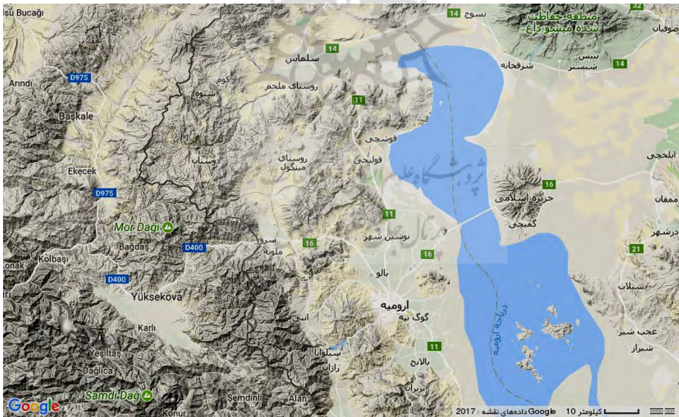
نقشه شماره دو: نحوه قرار گرفتن ارتفاعات مرزی میان دو کشور ایران و ترکیه