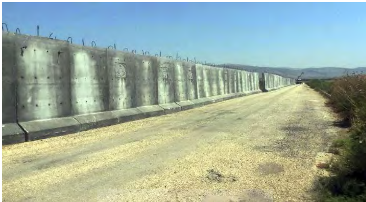
نمایی از دیوار بتونی مرزی میان ایران و ترکیه که توسط دولت ترکیه احداث شده است